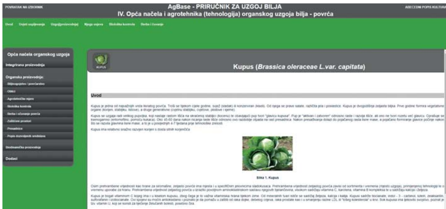
Slika 4. Izgled i sadržaj portala te dodatni detaljniji izbornici – upiti AgBase – Priručnika za uzgoj bilja III. Opća načela i agrotehnika (tehnologija) organskog uzgoja bilja – povrća