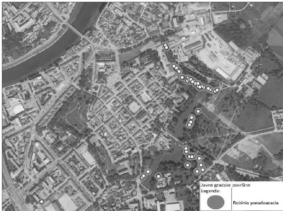
Slika 1. Kartografski prikaz lokacija stabala vrste Robinia pseudoacacia L. na javnim površinama u centru grada Karlovca