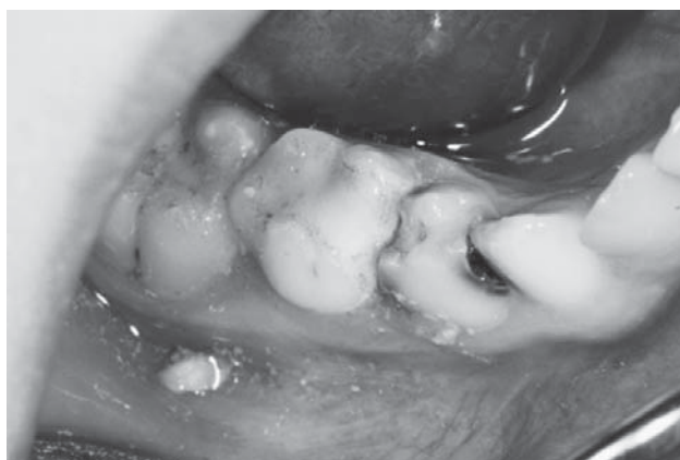
SLIKA 4. Završna restauracija stakleno ionomernim ispunom

2. Glutaraldehyd - u usporedbi s formokrezolom znatno je manje apsorbira u organizam, čime mu je štetno djelovanje manje. Aplikacijom na vitalnu pulpu dolazi do fiksacije površinskog sloja radikularne pulpe, dok dublji slojevi ostaju vitalni. Fiksirano se tkivo s vremenom nadomješta vezivom (1).