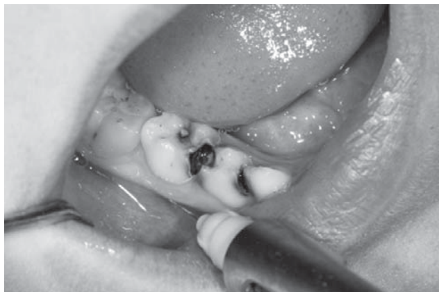
SLIKA 1. Lokalna anestezija

1. Formokrezol - dugo je bio sredstvo izbora kod pulpotomije mliječnih zuba, ali danas se napušta zbog potencijalnog toksičnog, mutagenog, karcinogenog i alergičnog učinka. Kod amputacije pulpe primjenjuje se 20 %-tna otopina formokrezola, u trajanju od 1 minute i rabi se od 0,02 – 0,1 mg formaldehida (1, 7, 21).