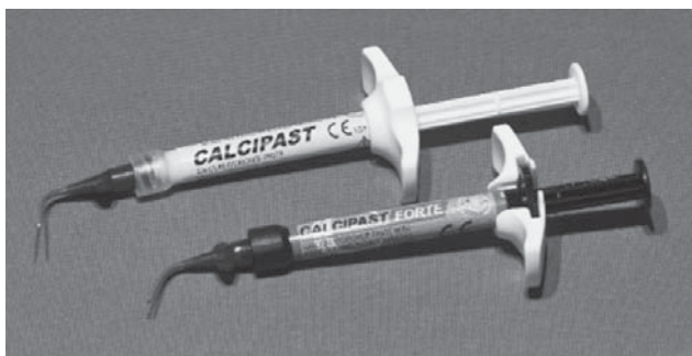
SLIKA 5. Pasta kalcij hidroksida

hanički okludira kapilare površinskog sloja radikularne pulpe. Željezo sulfat ima prednost pred formokrezolom i glutaraldehidom zbog svojeg minimalno štetnog učinka na cijeli organizam (1, 7, 21).