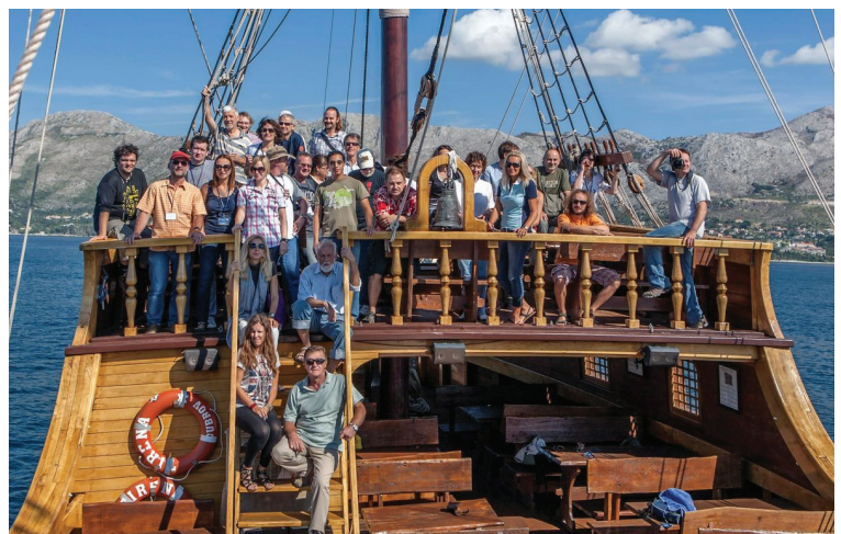
Skupna fotografija sudionika simpozija