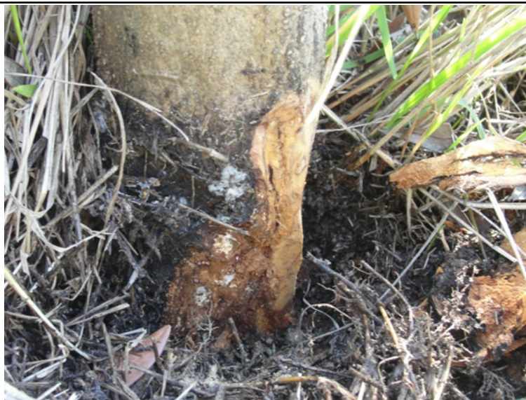
Slika 2. Simptomi na korijenovom vratu uzrokovani vrstom Armillaria mellea , 27. 10. 2016.

Fig. 2 Symptoms on root neck caused by species Armillaria mellea , October 27 th 2016.