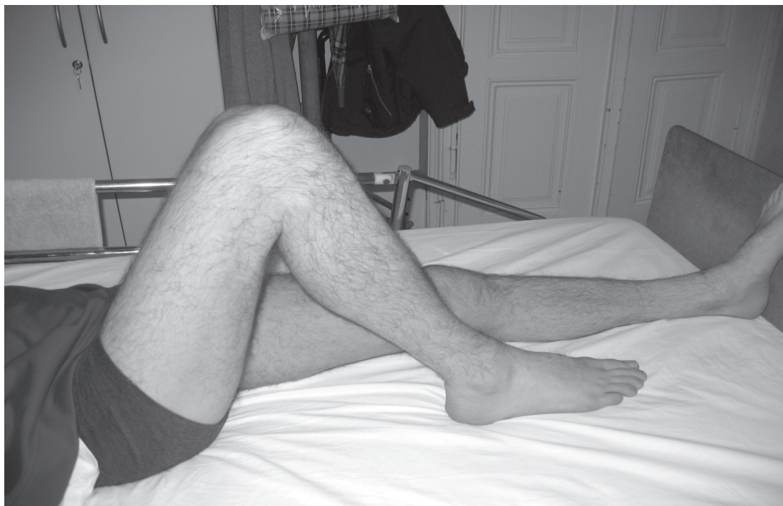
SLIKA 1. Kontraktura koljena prije aplikacije botulinum toksina A FIGURE 1.

Knee contractures before the application of Botulinum toxin A