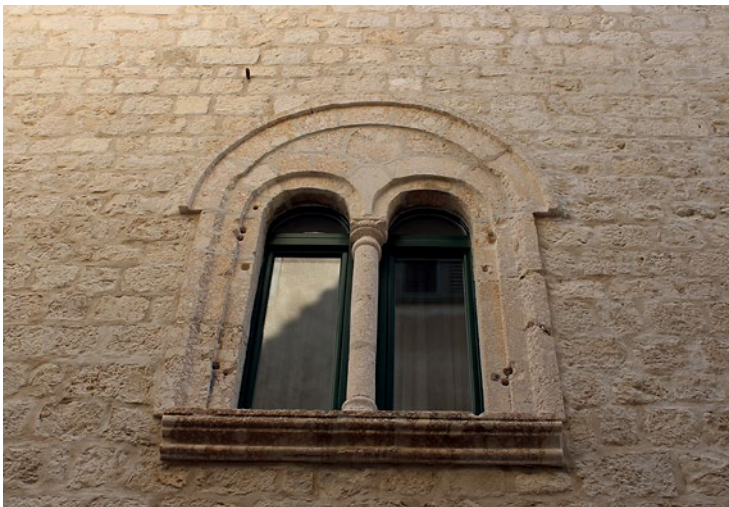
2a Zapadna bifora

Western mullioned window