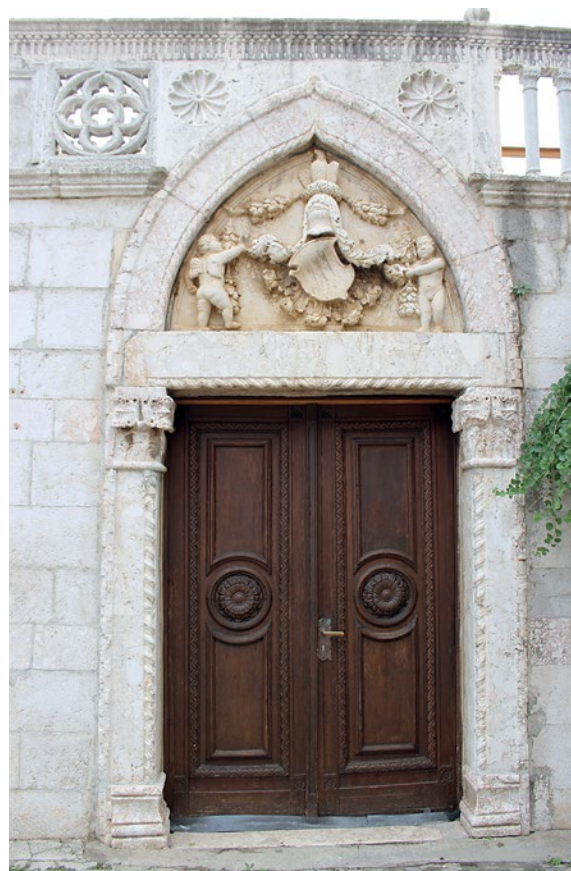
8 Portal palače Nimira

Naime, u gradu se mogu pronaći ugaoni stupići s kapitelima i bazama, no većina njih danas ipak ima ili samo kapitel ili samo bazu. Baze se