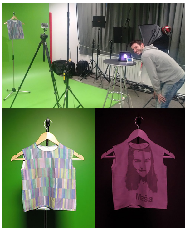
Slika 2 Eksperiment rasvjetljavanja objekta umjetnom rasvjetom

Uvodeći dvostruke snimke ZRGB-M video kamerama paralelnog bilježenje vidljivog i nevidljivog spektra izrađena knjiga snimanja filma unaprijeđena je dijelom koji prikazuju infracrvene informacije. U metodi grafičke tehnologije paralelne reprodukcije vizualnog i infracrvenog spektra nadograđena je uporaba filmske klape za sinhronizaciju video blizanaca. Kreiranjem produkcijskog procesa filmskih radova dvostrukog spektra izvedena je nova infracrvena filmska tehnologija.