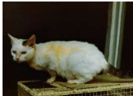
Sl. 3. 30 dana nakon početka terapije