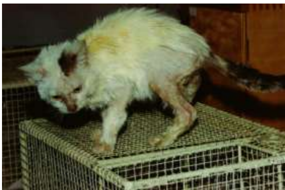
Sl. 1. Prije početka terapije