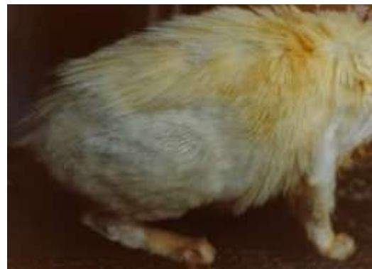
Sl. 2. 18 dana nakon početka terapije

Vidljivo je da brojne vrste domaćeg bilja koje se koriste kao začini, imaju izvrsna antimikrobna djelovanja pa su time u svakodnevnoj funkciji očuvanja hrane od kvarenja, ali i očuvanja našeg zdravlja (tablica 1). Ispitano bilje ima relativno širok spektar mikrobicidnosti na gram-pozitivne i gram-negativne bakterije, kao i fungicidnosti na gljivice iz roda Candida i plijesni. Očito je da brojne biljke sadrže korisne biološki aktivne tvari na kojima se temelji nekadašnja i današnja fitoterapija.