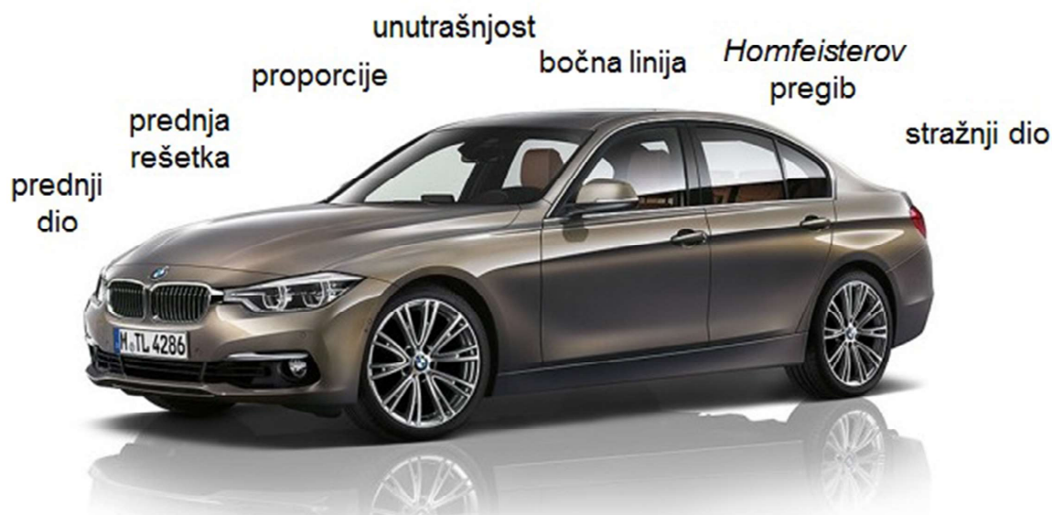
Slika 1 Elementi percepcije vanjskog dizajna (BMW, serija 3) [10, p.406]