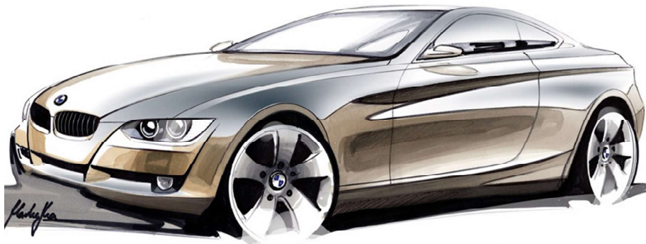
Slika 3 Ručna skica eksterijera (BMW, serija 3, Coupe) [9, p.130]