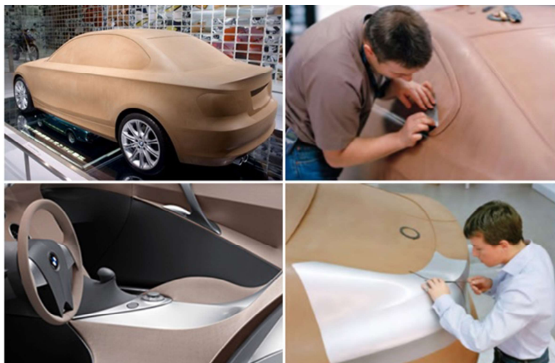
Slika 4 Dizajn korekcije eksterijera i interijera 1:1 glinenog modela (BMW) [10, str:414]