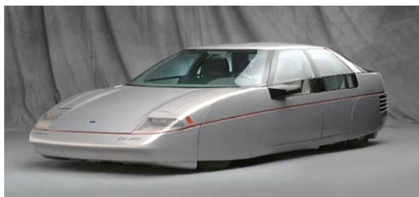
Slika 5 Konceptualni model Ford probe IV, CD=0,152

Validacija je utvrđivanje prihvatljivosti dizajna. Primjenjuju se različiti alati i metode dokaza valjanosti dizajna. Stiliziranje eksterijera i interijera dokazuje se pomoću CAS modela, vizualizirano u slikama, projekcijama ili okruženjima virtualne stvarnosti. Realno predstavljanje površina, materijala i tekstura, dopušta stvarnu percepciju izgleda eksterijera i interijera bez nužnosti skupih fizičkih prototipova.