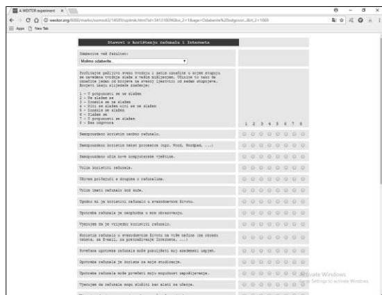
Slika 4. Prikaz upitnika na zaslonu stolnog računala

Na Slici 2 vidimo prikaz jednog upitnika na pametnom telefonu s rezolucijom 720x1280 piksela i veličinom zaslona 4,8" dok na Slici 3 vidimo isti taj upitnik, ali s uključenom virtualnom