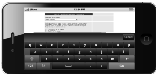
Slika 3. Prikaz upitnika na pametnom telefonu s uključenom virtualnom tipkovnicom