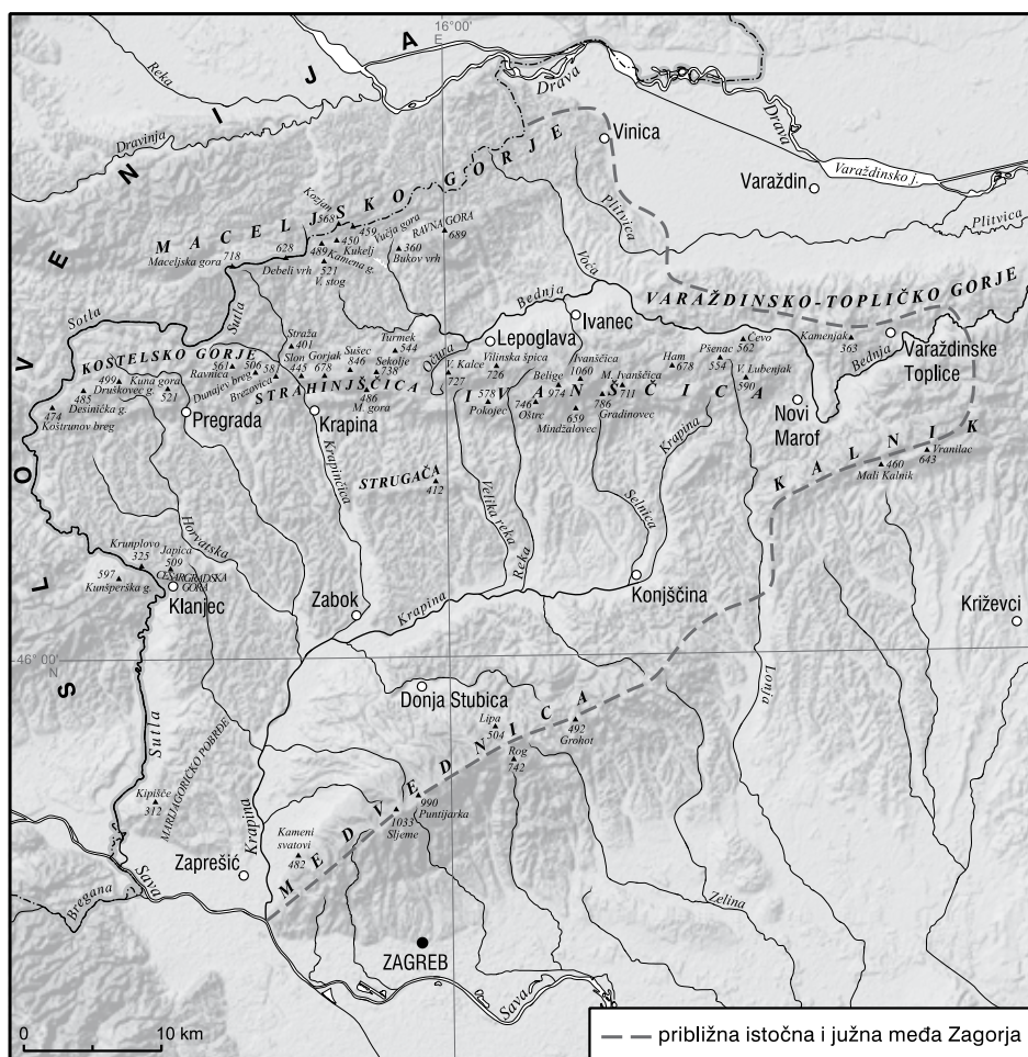
Slika 3. Karta zagorskoga područja s prirodnim međama

zadaća uredništva Enciklopedije Hrvatskoga zagorja bila je da područje svojega zanimanja omeđi u skladu s najširim od izloženih koncepcija, a da se pritom ipak pokuša držati makar nekih čvrstih kriterija. Do konačnoga odgovora na pitanje što je Hrvatsko zagorje, došli smo u dva koraka. U prvome smo spoznaje iz literature promotrili na zemljovidu i okvirno iscrtali približnu među s obzirom na državnu granicu i glavne prirodne sadržaje, a u drugome smo tu crtu »korigirali« s obzirom na postojeće granice manjih upravnih cjelina, općina i gradova. Promatrano u cijelosti (slika 3), zagorsko je područje na zapadu, a djelomice i na sjeveru, jasno omeđeno rijekom Sutlom, koja je ujedno i današnja državna granica. Štoviše, rijeka Sutla nije samo današnja granica nego je stara hrvatsko-štajerska pokrajinska granica, jedna od najdugotrajnijih i najstabilnijih političkih granica u Europi. Sutla je granična rijeka go-