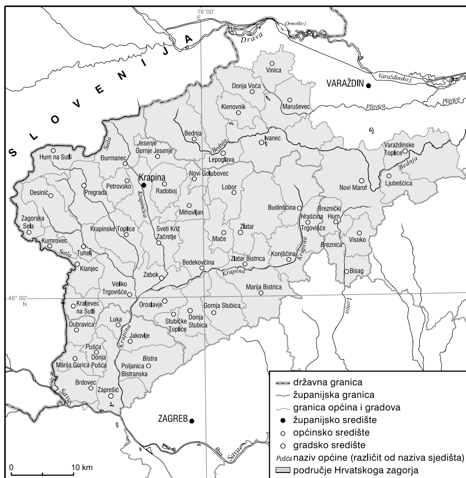
Slika 4. Karta upravne podjele zagorskoga područja

kle, prilagodili političkim granicama. Oko Krapinsko-zagorske županije nije bilo nikakvih dvojbi, po svim dosad spomenutim autorima nju je trebalo uključiti u cijelosti. U Varaždinskoj županiji bilo je potrebno odrediti koji će se njezin dio smatrati sastavnim dijelom Zagorja, dok se u Zagrebačkoj županiji trebalo odlučiti hoće li se uključiti njezin sjeveroistočni dio, koji se nalazi sjeverno od Save i Medvednice. U Varaždinskoj smo županiji izdvojili i uključili one dijelove tj. općine (gradove) koji udovoljavaju krajobraznome opisu, dok smo izostavili one općine koje obuhvaćaju nizinsko pridravsko područje (slika 4). Gledano od zapada prema istoku, prvo smo bez imalo dvojbe uključili općine Bednja i Klenovnik te gradove Ivanec i Lepoglavu. Nešto više dvojbe bilo je oko općina koje se nalaze istočnije od spomenutih, jer su one po svom položaju granične unutar zagorskoga područja. Ako se taj rubni niz općina