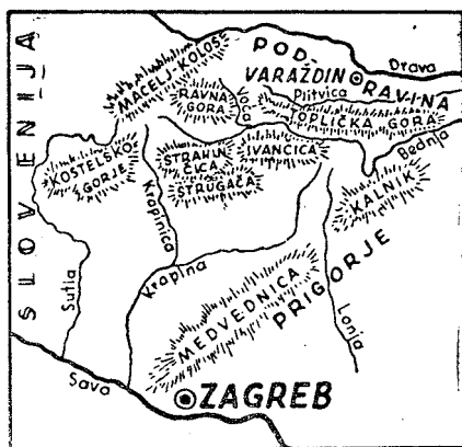
Slika 2. Skica zagorskog područja preuzeta iz V. Blašković, Hrvatsko zagorje (1957), str. 202.