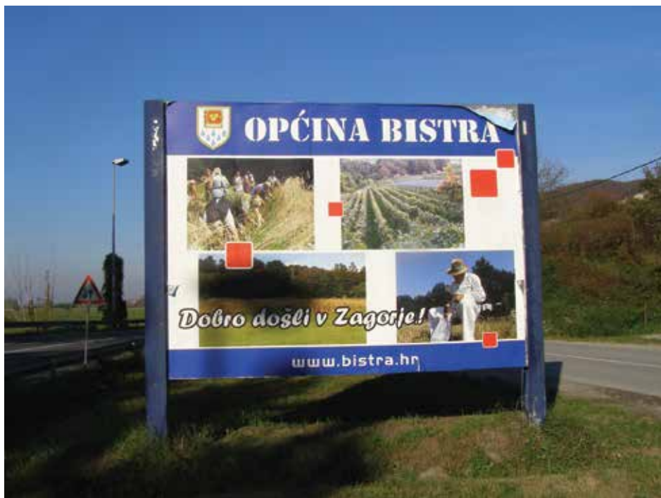
Slika 5. Plakat općine Bistra

dnevi je sve raširenije shvaćanje prema kojemu je Hrvatsko zagorje po teritorijalno-me opsegu danas jednako području Krapinsko-zagorske županije. Dijelovi Zagorja koji se nalaze u sastavu Varaždinske odnosno Zagrebačke županije, prema stečenome uvidu, danas su manje »zagorski« nego što su bili početkom 1990-ih, kada je današnja upravna podjela stupila na snagu. Za uredništvo Enciklopedije to nije bilo presudno pri donošenju odluke koje područje treba obuhvatiti, što smo i ovim pregledom željeli pokazati. Stoga nas raduje kada makar i na banalnim predmetima ili situacijama uočimo detalje koji upućuju na zaključak da je u svakodnevici još uvijek živa svijest da horonim Hrvatsko zagorje ne završava na granici Krapinsko-zagorske županije. Kao primjer donosimo turistički plakat općine Bistra (slika 5), snimljen početkom 2017., na kojemu je vidljivo iskazana pripadnost toga područja Zagorju.