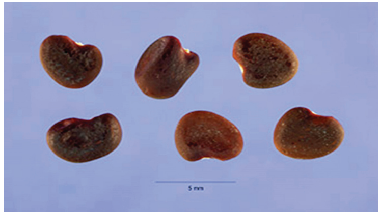
Slika 6. Sjeme ( C. arborescens )