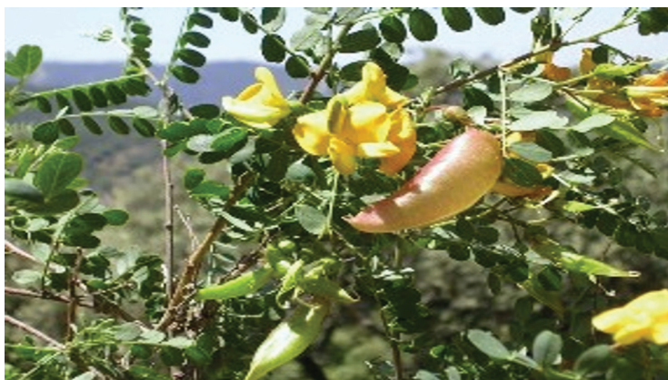
Slika 10. C. hispanica