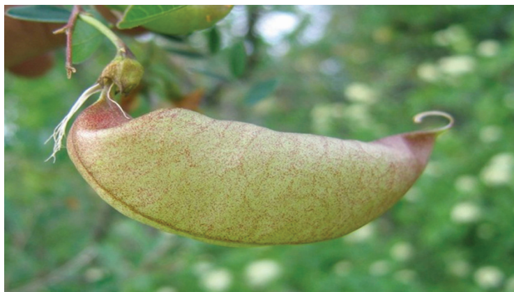
Slika 5. Plod ( C. arborescens )