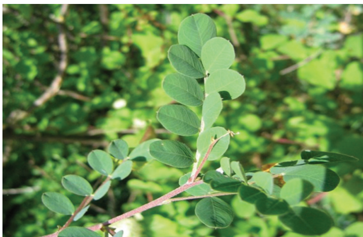
Figure 3. Leaves and branches ( C. arborescens )