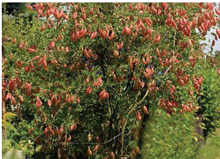
Figure 9. C. orientalis