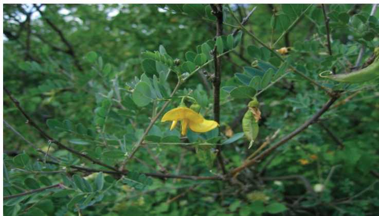
Slika 4. Cvijet ( C. arborescens )

Malobrojni cvjetovi (leptirastog) oblika, žuto su obojani i nalaze se u pazušcima lista te su sklopljeni u grozdove (slika 4.). Cvate u periodu od svibnja do kolovoza. Plod sadrži do 30 bubrežastih tvrdih sjemenki sivo crne boje (slika 6.), a dugačak je 6-8 cm i ima izgled kožičaste mahune s gotovo prozirnim stjenkama. Dugo poslije opadanja listova, mahuna ostaje na grmu, te postaje nabreknuta i mjehurasta (slika 5.). (Kovačić et al 2008.).