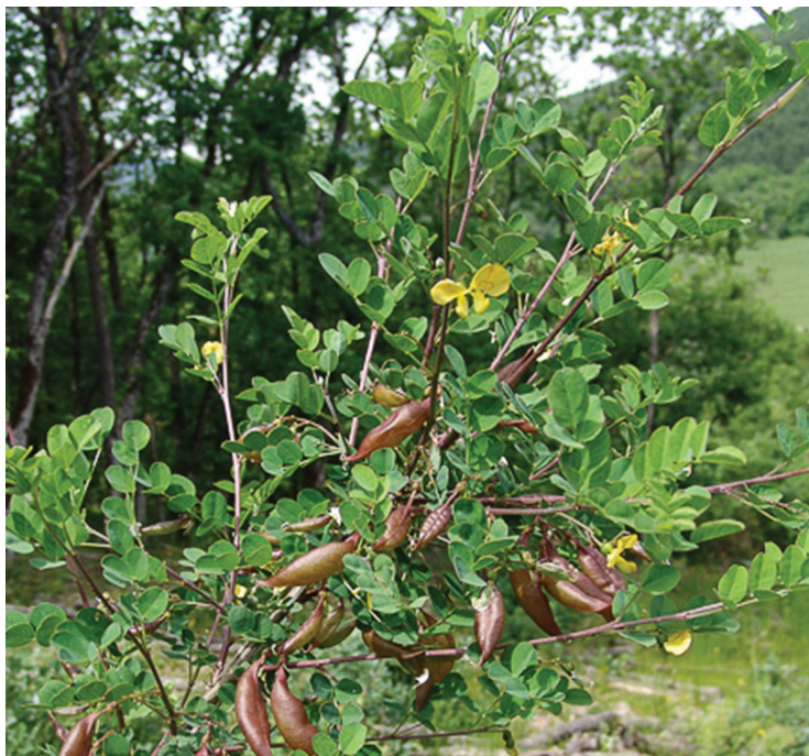
Slika 3. Listovi i grančice ( C. arborescens )