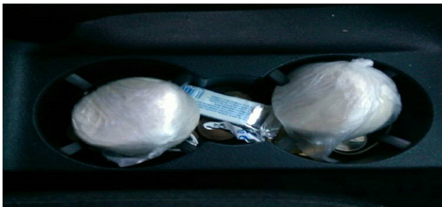
Fotografija broj 5 1