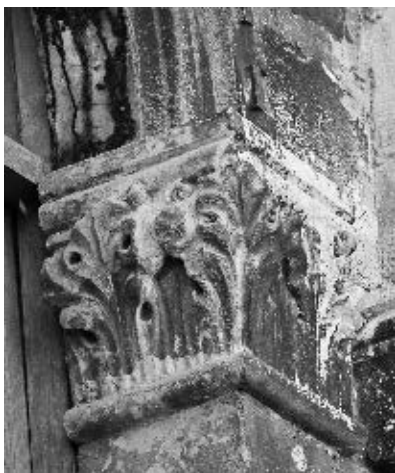
Radionica Jurja Dalmatinca, kapitel prozora prvoga kata, »Mala Papalićeva palača«, Split