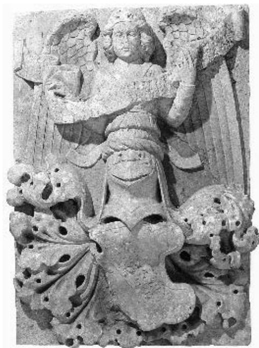
Andrija Aleši, reljef anđela, Muzej grada Omiša (nekad u zbirci Radman)

ske katedrale kojega, također, ne možemo smatrati njegovim vlastoručnim ostvarenjem, već možda radom Marina Veseljkovića koji mu je početkom 1455. godine pomagao klesati ogradice, 32 jedino djelo iz njegova ranog splitskog razdoblja koje bi moglo biti Alešijev vlastoručni rad jest reljef anđela koji potječe iz zbirke Radman u Omišu 33 . Iako se po tipu odjeće, oblikovanju frizure očigledno više oslanja na Jurjeve anđele štitonoše sa Stašovog ciborija nego li na anđele iz lunete Male palače, ovaj Alešijev anđeo bitno zaostaje u kvaliteti. No još je značajnije njegovo široko i pomalo plosnato lice, što ga kasnije srećemo i na njegovim drugim kvalitetnijim ostvarenjima – anđelima na sceni Krštenja Kristova na pročelju trogirске