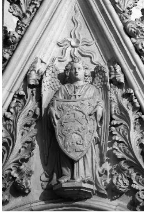
Juraj Dalmatinac, anđeo štitonoša s ciborija sv. Staša, katedrala sv. Dujma, Split (o. 1448. – 1450.)

Ipak, unatoč svim prepoznatljivim elementima Jurjeva kiparskog izraza, ne možemo preskočiti činjenicu kako se glave anđela ipak ponešto razlikuju od svih drugih njegovih, u tim ranim djelima poprilično tipiziranih anđeoskih fizionomija. Naime, iako se donekle srodna punašna dječja lica susreću u njegovoj galeriji »portreta« na frizu šibenske katedrale, ovako jedre okruglaste glave punašnih obraza s malom istaknutom bradom ne susrećemo niti na svodu šibenske krstionice, niti na licu anđela u tjemenu svoda Arnirove kapele, a ni na onome koji pridržava zastor nad grobom bl. Arnira. Jednako tako, ne nalazimo ih niti na brojnoj skupini anđela koje je izveo na grobnici sv. Staša u splitskoj katedrali, s time da se one pogotovo razlikuju od anđela štitonoša sa zabata Staševa ciborija koji se od svih spomenutih odvajaju heraldičkom strogošću i ozbiljnošću izraza 30 [sl. 6]. Na pretpostavku o mogućem udjelu neke druge ruke u izvedbi anđela štitonoša u luneti portala Male Papalićeve palače donekle upućuje i obrada duge valovite kose počesljane u dugim, ali za Jurja ipak ponešto neprirodno počesljanijim, pravilnim zmijolikim pramenovima. Ipak, veći se odmak zamjećuje u neobičnoj izvedbi njihovih malih, lagano stisnutih očiju. Umjesto plastičnog modeliranja očnih jabučica te jasnog iscrtavanja zjenica, kapaka i mekih vjeđa, kao i nadočnih lukova obrva kakvo se sreće na drugim Jurjevim fizionomijama, ovdje su oči lagano