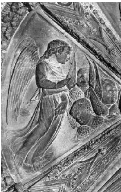
Juraj Dalmatinac, reljef na svodu krstionice, katedrala sv. Jakova, Šibenik (o. 1441. – 1446.)