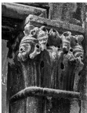
Radionica Jurja Dalmatinca, kapitel bifore, »Mala Papalićeva palača«, Split

ti već s friza dvosmjernog, vjetrom povijenog lišća iz šibenske katedrale, uvrću se prema središnjoj, lagano atrofiranoj i poduvučenoj resi. Istaknuta dvozonka podjela i naglašena linearna oštrobridna stilizacija žilavog, vertikalno pruženog podanka kao da nema ništa zajedničko sa živim, naturalistički oblikovanim listovima koje susrećemo u ponajboljim Jurjevim djelima, kako u Šibeniku – na zapadnom paru velikih kapitela križišta šibenske katedrale – tako i u Splitu – na kapitelima trijumfalnog luka Arnirove kapele ili na onom živom, poput plamena