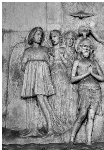
Andrija Aleš i Nikola Firentinac, detalj reljefa »Krštenje Kristovo«, krstionica katedrale sv. Lovre, Trogir (o. 1467.)