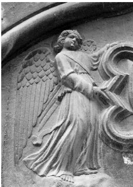
Juraj Dalmatinac, detalj lunete, »Mala Papalićeva palača«, Split