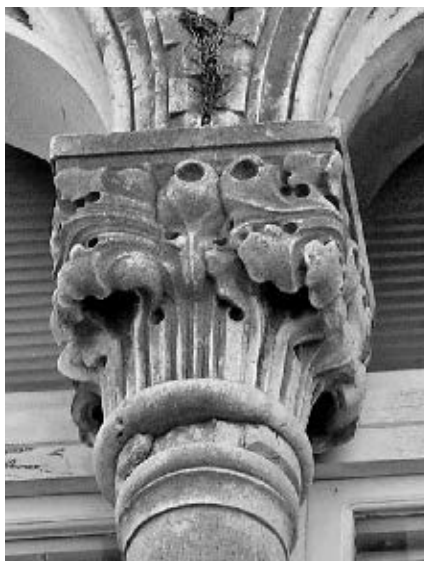
Radionica Andrije Alešija, kapitel kvadrifore, »Velika Čipikova palača«, Trogir

ko-gotičke palače, odnosno izrade njezine nove klesarsko-kiparske opreme. U relativnoj kronologiji Dalmatinčevih ostvarenja na tlu Dioklecijanove palače, smatram da je ona nastala na samom početku njegova djelovanja u Splitu – paralelno s gradnjom Arnirove kapele ili odmah po njezinu dovršetku, sredinom ili tijekom druge polovice 40-tih godina – ali gotovo sigurno prije gradnje osnovne jezgre Velike Papalićeve palače jer ona pokazuje stilski napredniji i ujednačeni karakter već standardizirane kamenoklesarske produkcije.