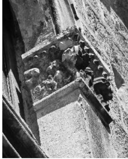
Nepoznati majstor, južno pročelje – kapitel drugoga kata, »Velika Papalićeva palača«

šta na Teatru ponešto drugačiji, više mletački s jednostavnim kružištem, točnije nešto što bismo mogli nazvati tzv. »pločastim mrežištem« ( plate tracery ) koje se sastoji od dva cijela i dva polovična četverolisna otvora koji između lukova trifore i vanjskog pravokutnog okvira rastvaraju plohu zida, ipak možemo pretpostaviti kako je ovo hibridno Jurjevo rješenje s anđelom štitonošom uglavljenom po sredini kvadrifore najvjerojatnije bilo potaknuto željom samoga naručitelja koji mu je kao uzor postavio onu raskošnu balkonatu s nekadašnjeg kazališta na glavnome gradskom trgu. 71 Ako prihvatimo mogućnost kako je i jedan poligonalni kapitel sa sjevernjačkim, žilama prošaranim listovima iz zbirke Radman također bio dio te trifore sa srušene Kneževe palače, onda smo blizu moguće zagonetke o podrijetlu tog neobičnog i za jurjevski repertoar motiva svakako izuzetnog motiva. 72