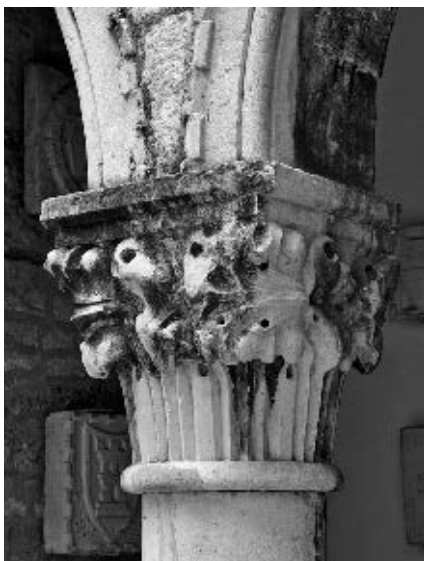
Radionica Jurja Dalmatinca, kapitel lože, »Velika Papalićeva palača«, Split