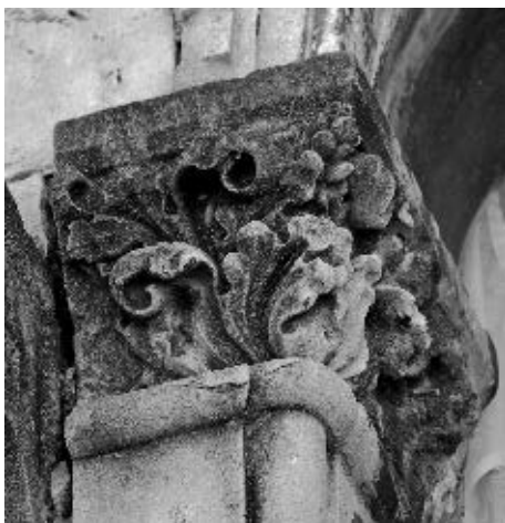
Radionica Jurja Dalmatinca, kapitel doprozornika bifore, »Mala Papalićeva palača«, Split