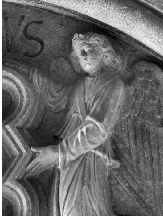
Juraj Dalmatinac, detalj lunete Male Papalićeve palače, Split

utonule, a plitkim paralelnim urezima rubovi kapaka su tek naznačeni, odnosno čak ni to – na licu desnog anđela više iscrtane nego modelirane oči jedva se naziru ispod jednostavnog bademastog proreza. Na kraju, valja zamijetiti i to kako su kod svih Jurjevih likova glave u pravilu znatno veće, te često u napetom odnosu prema tijelu, a zajedno s oštro iscrtanim crtama lica, znatno pridonose ukupnoj izražajnosti figura. No ovdje je gotovo suprotno – glave su normalne veličine, a na njima dominira blagi i pomalo odsutan izraz lica.