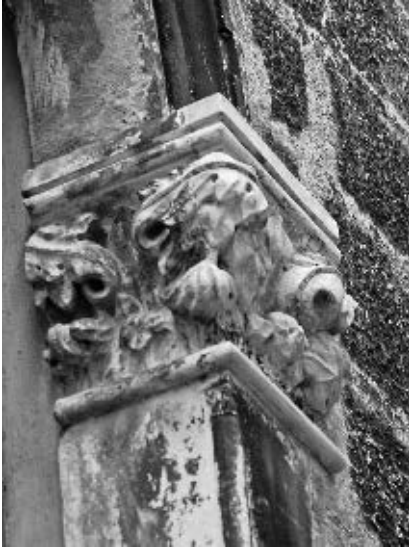
. Nepoznati majstor, južno pročelje – kapitel prvoga kata, »Velika Papalićeva palača«, Split