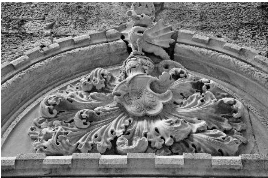
Juraj Dalmatinac, luneta dvorišnog portala, »Velika Papalićeva palača«, Split

ditelju velike palače, nju osporava i drugi Papalićev grb izveden u luneti velikog dvorišnog portala. Osim što na njemu također ne možemo uočiti tragove naknadnog preklesavanja, iznimna kvaliteta bujnog kovrčastog lišća koje se uokolo njega rasprostire u prvi plan stavlja Jurja Dalmatinca kao autora čitavog portala, a ne Andriju Alešija. 63 Zanimljivo, potvrdu o suradnji te dvojice majstora pruža nam anđeo štitonoša sred kvadrifore palače, s time da ipak svi ostali elementi ukazuju na Jurja kao idejnog tvorca, zapravo projektanta čitavog građevinskog sklopa.