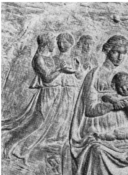
Krug Luca della Robbia, detalj reljefa »Bogorodica sa šest anđela«, Louvre, Paris (o. 1430.), (izvor: S. Kokole, 1985.)