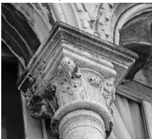
Radionica Jurja Dalmatinca, kapitel dovratnika ulaznog portala, »Mala Papalićeva palača«, Split