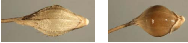
Slika 5. Sjeme koštana s pljevicama (lijevo) i bez pljevica (desno)