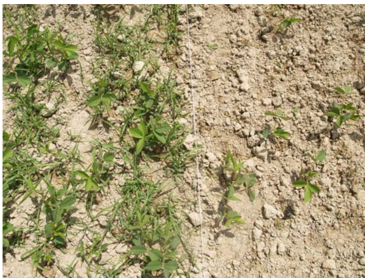
Slika 1. Koštan u soji – zakorovljena (desno) i nezakorovljena parcela (lijevo)