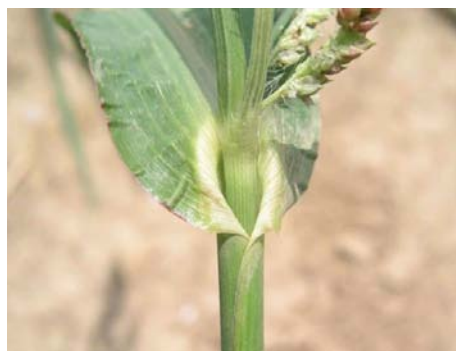
Slika 3. Rukavac koštana – odsutne uške i jezičac