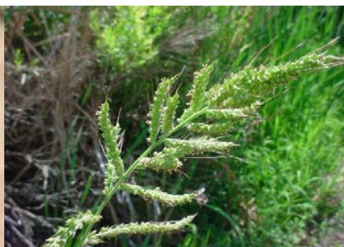
Slika 4. Cvatnja koštana