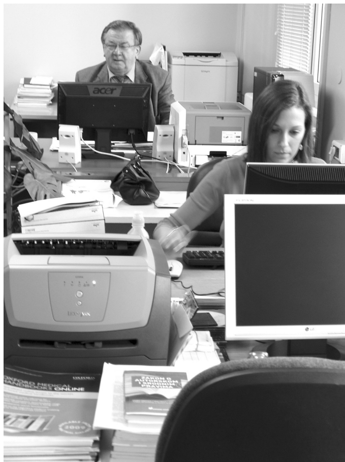
SLIKA 6. Znanstvena jedinica za kliničko-medicinska istraživanja snažan je promotor razvoja Kliničkoga bolničkog centra u Osijeku

IMAGE 6 Scientific unit for clinical and medical research is a strong promoter of development of the University Hospital Centre in Osijek