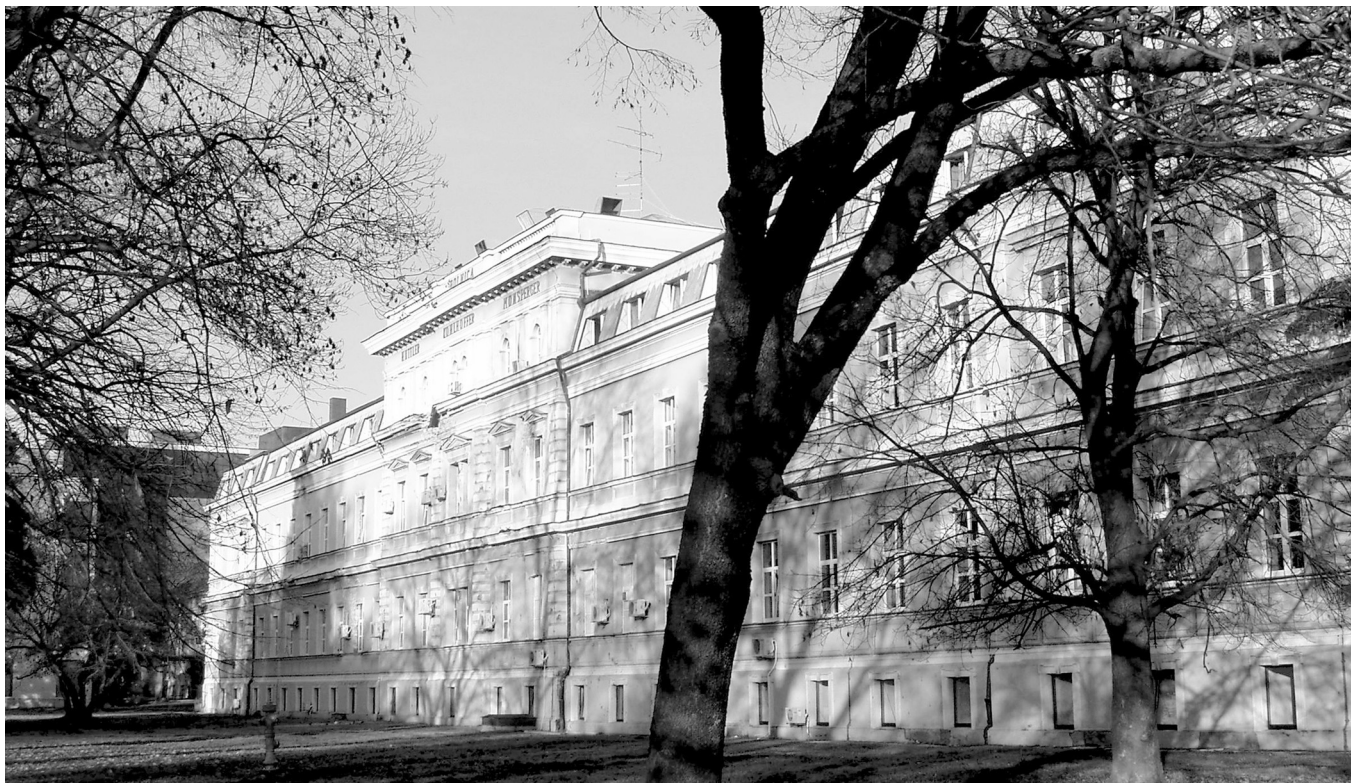
SLIKA 4. Huttler-Kohlhoffer-Monspergerova povijesna zgrada u sastavu Kliničkoga bolničkog centra Osijek, 2009. godine. IMAGE 4 Huttler-Kohlhoffer-Monsperger historical building, part of the University Hospital Centre in Osijek, 2009