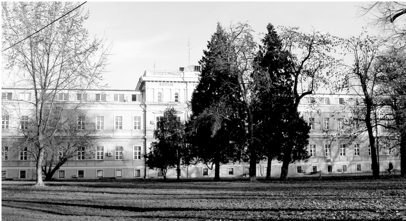
SLIKA 3. Huttler-Kohlhoffer-Monspergerova povijesna zgrada u sastavu Kliničkoga bolničkog centra Osijek, 2009. godine. IMAGE 3 Huttler-Kohlhoffer-Monsperger historical building, part of the University Hospital Centre in Osijek, 2009