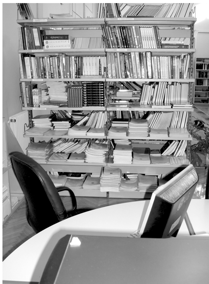
SLIKA 7. Stručna knjižnica Kliničkoga bolničkog centra u Osijeku. Digitalno ili analogno, uvijek stoje na raspolaganju.

IMAGE 6 Scientific unit for clinical and medical research is a strong promoter of development of the University Hospital Centre in Osijek