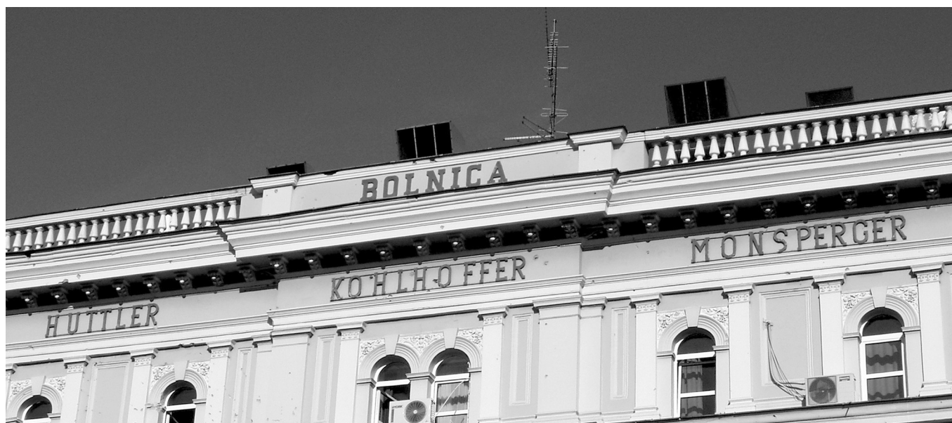
SLIKA 2. Huttler-Kohlhoffer-Monspergerova zakladna bolnica iz 1874. godine, danas je Klinika za unutarnje bolesti, u sastavu Kliničkoga bolničkog centra Osijek. IMAGE 2 Huttler-Kohlhoffer-Monsperger Foundation Hospital from the year 1874, nowadays Clinic for Internal Diseases, part of the University Hospital Centre in Osijek