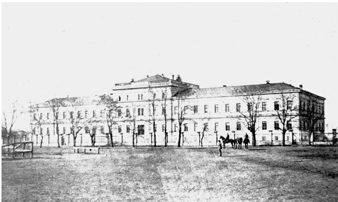
SLIKA 1 Huttler-Kohlhoffer-Monspergerova zakladna bolnica 1874. IMAGE 1 Huttler-Kohlhoffer-Monsperger Foundation Hospital, 1874