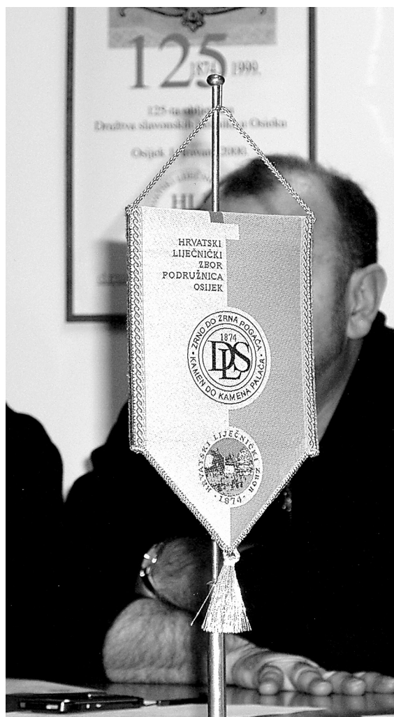
SLIKA 2a. Zastavica HZL-a Podružnica Osijek IMAGE 2a Small flag of the CMA - Osijek Branch

Za izradu rada koristilo se Izvješćima o radu Hrvatskoga liječničkog zbora – Podružnice Osijek od 1992. do 2008., te podatcima Povjerenstva za dodjelu odličja HLZ-a.