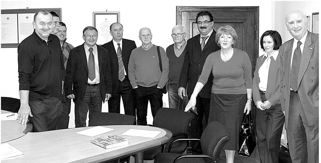
SLIKA 3. “Zrno do zrna, član do člana” - zajednička fotografija na tragu kontinuiteta tradicije IMAGE 3 "Many a little..." - a group photo following the tradition continuity