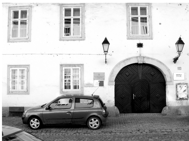
SLIKA 6. Dva donja lijeva prozora i karakterističan portal čine sastavni dio pročelja pročelja prostorija HZL-a Podružnice Osijek IMAGE 6 Two lower left windows and a distinctive portal make up the integral part of the front of the CMA - Osijek Branch premises