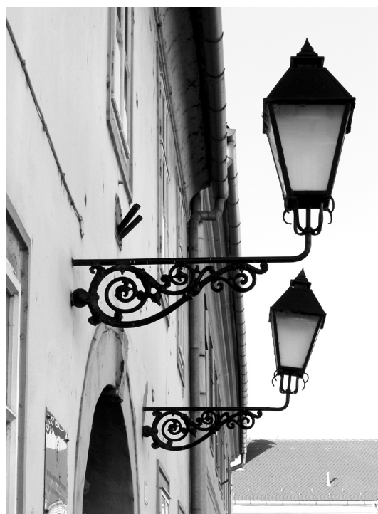
SLIKA 8. Karakteristične svjetiljke nad portalom IMAGE 8 Distinctive street lights over the portal