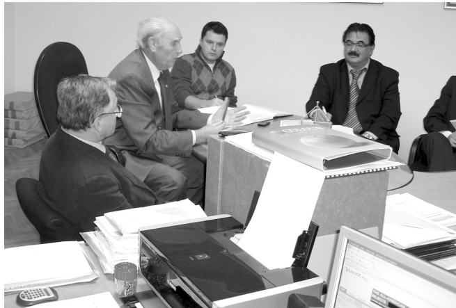
SLIKA 2. “Zrno do zrna pogača, dogovor do dogovora palača” - radni dogovor odbora HZL-a Podružnice Osijek, u duhu tradicije “Društva slavonskih liečnika u Osieku” IMAGE 2 "Many a little makes a mickle" - Committee meeting of the CMA - Osijek Branch, in the spirit of tradition of Društvo slavonskih liečnika u Osieku (Croatian Medical Association in Osijek)