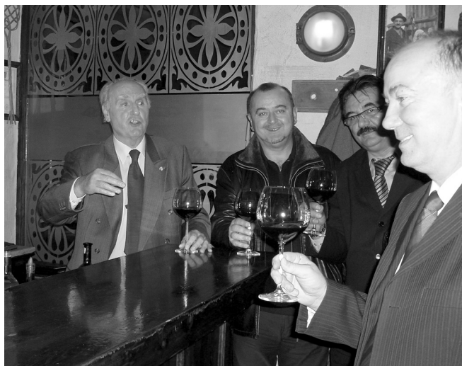
SLIKA 4. Trenutki opuštanja do sljedećeg zrna... IMAGE 4 Moments of relaxing...