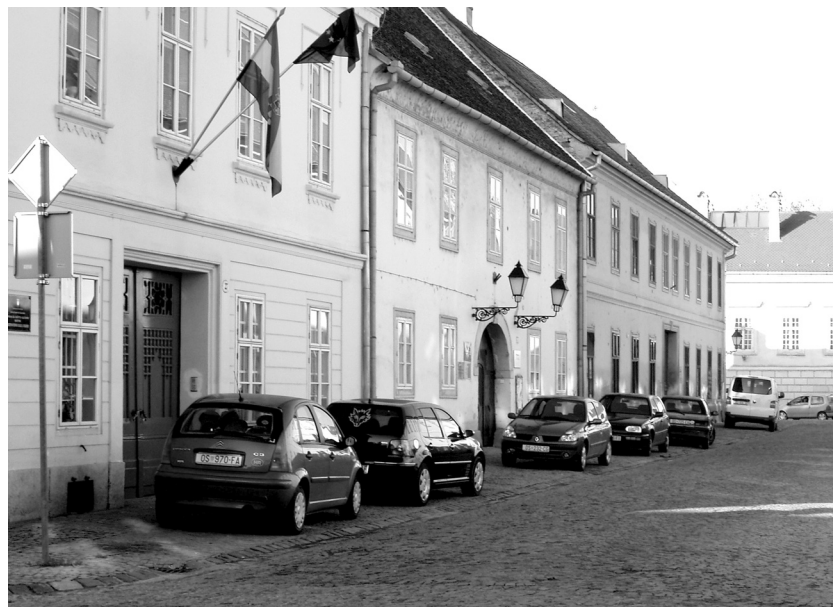
SLIKA 5. Prostorije HZL-a Podružnice Osijek, nalaze se u baroknoj Tvrđi, u Kuhačevoj ulici 29 IMAGE 5 The CMA - Osijek Branch premises are situated in the Baroque Tvrđa, 29 Kuhačeva Street