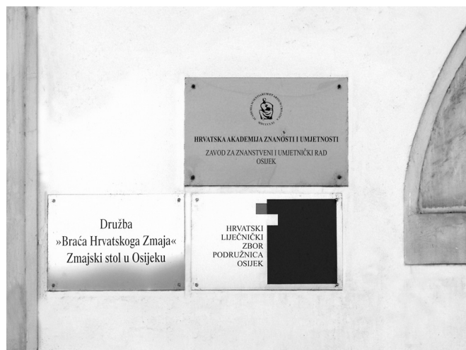
SLIKA 7. Karakteristična natpisna ploča HZL-a Podružnice Osijek, sustanari i susjedi IMAGE 7 Characteristic signboard of the CMA - Osijek Branch, cotenants and neighbours