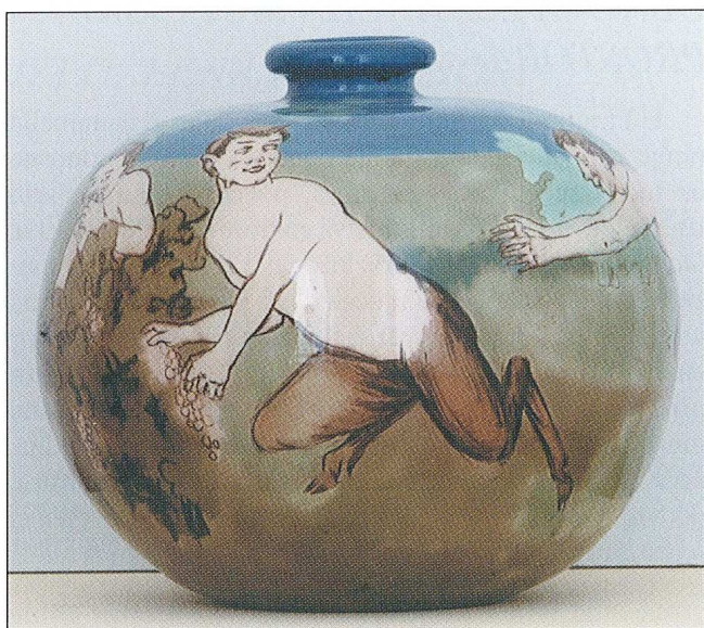
Sl. 6 Signirana vaza poznate mađarske tvornice Zsolnay iz prve polovice 20. st.