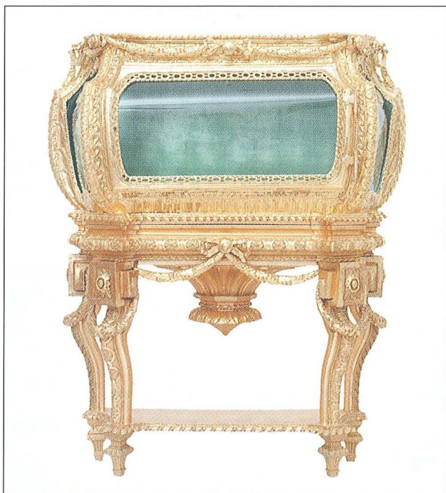
Sl. 1 Relikvijar, 18. st., Louis XVI., Francuska, drvo, pozlata