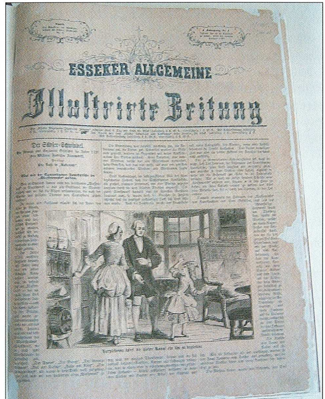
Sl. 4 Uvez osječkih novina "Esseker Allgemeine illustrierte Zeitung" iz 1869. g.e, prvih ilustriranih novina u Hrvatskoj

Najveći dio metalnih predmeta sa arheoloških iskopavanja i predmeta za pojedine izložbe obrađeno je