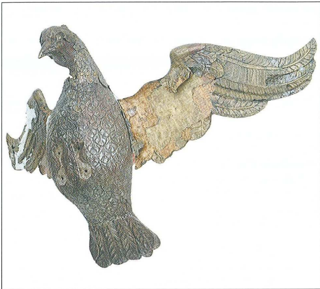
Sl. 3 Ptica - sv. Duh, originalna skulptura od posrebrnog iskucanog bakrenog lima, ranije sastavni dio Kužnog pila na Trgu sv. Trojstva u Osijeku