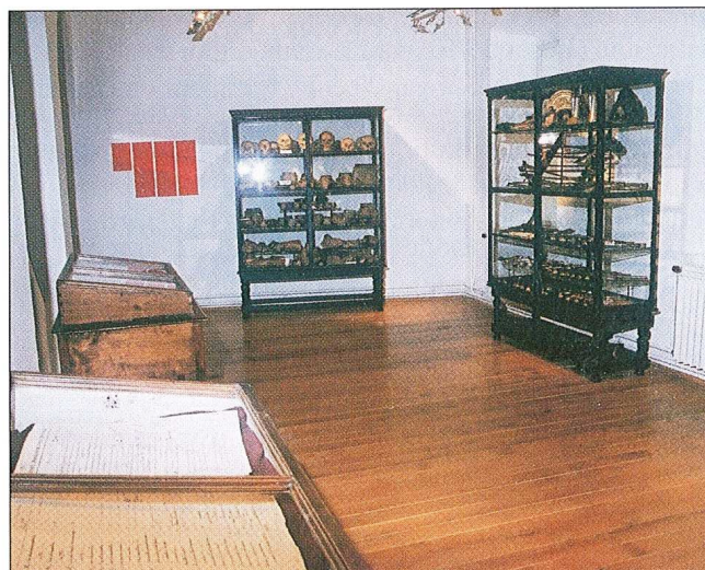
Sl. 7 Izložba "125 godina Muzeja Slavonije u Osijeku"