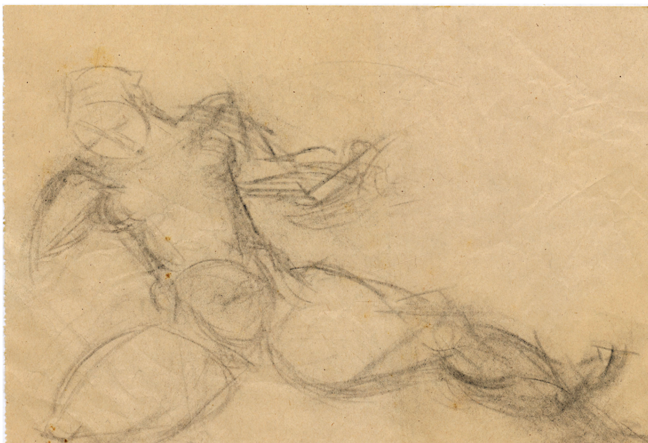
Jelena Dorotka Hoffman, Skica , olovka na papiru, 1907–1914, Državni arhiv u Dubrovniku / Jelena Dorotka Hoffmann, Sketch , pencil on paper, 1907–1914, Državni arhiv u Dubrovniku

je nastao i kratki koncept biografije Jelene Dorotke Hoffmann, pisan Strajničevom rukom koji ovdje donosimo u cijelosti: »Rođena 1. marta 1876 u Dubrovniku. Otac bio viši oficir i neko vrijeme komandant mjesta u Dubrovniku. Poslije osnovne škole studirala godinu dana na učiteljskoj školi. Zatim je pošla u Trst i svršila punu srednju školu. U Ljubljani svršila kurs za tri strana jezika: francuski, talijanski, njemački. U 22. godini udala se za Otona Hofmana, poručnika 22. austrougarske regimente u Dubrovniku. 1906 g. on je u svojoj 33-ćoj godini umro. Poslije muževljeve smrti Jelena Hofman pošla je u Basel kod kunjada svoga oca. U Baselu je godinu i po studirala slikarstvo i kiparstvo. Iz Basela je otputovala u Pariz. Tu je nastavila slikanje i naskoro se upoznala sa Picassom, Matisse-om i Šagalom. U Parisu se srela i sa Ivanom Meštrovićem. Neko vrijeme radila u školi Matisse-a. Kasnije je iz Pariza krenula za Španiju i tu je provela cijelo vrijeme Prvog svjetskog rata. 1922. vratila se u Dubrovnik i tu živi sve do danas. Uživa skromnu penziju: 4950 dinara mjesečno. [1913/14 aranžirala izložbu s Vasiljevnom u Mo-