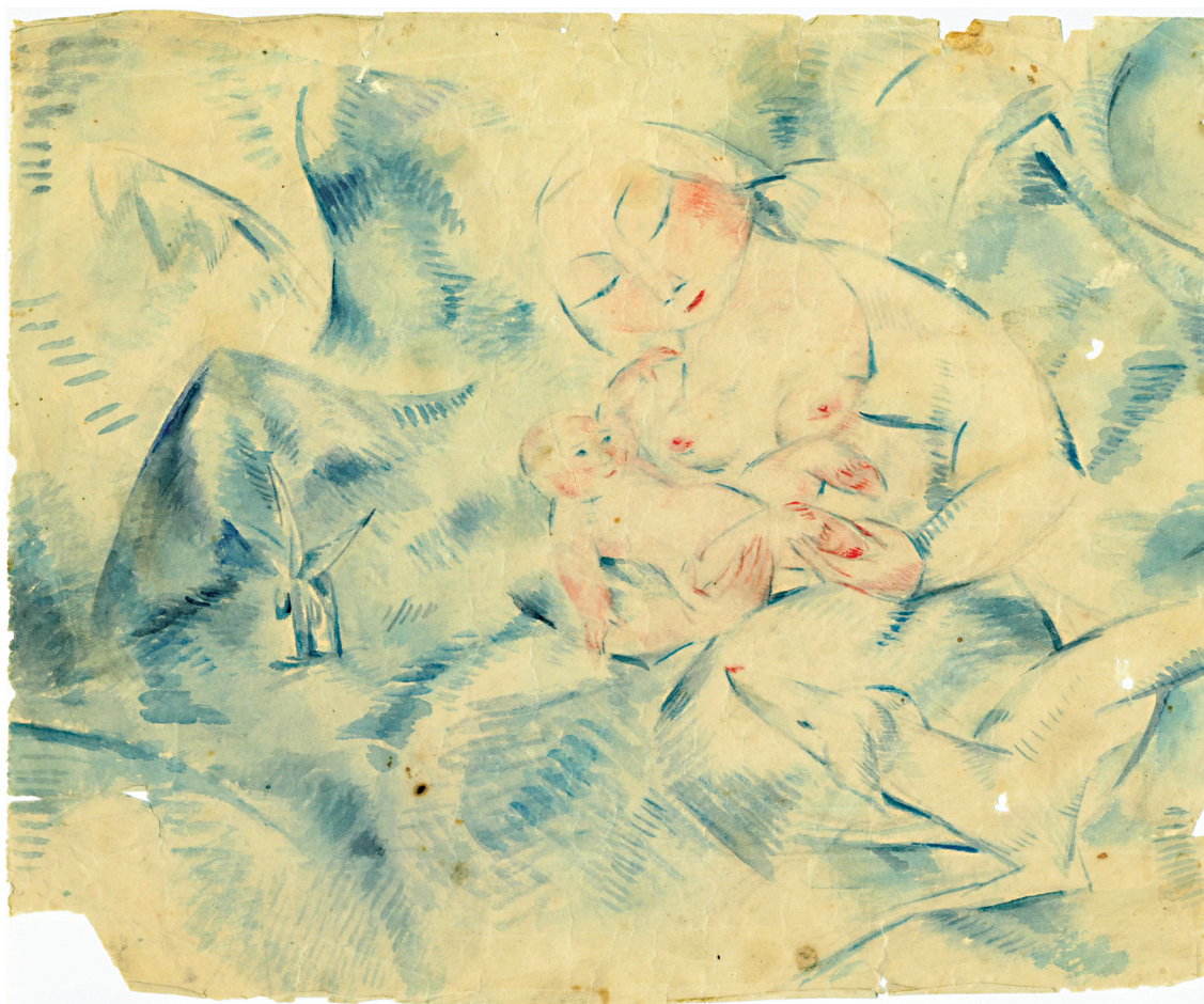
Jelena Dorotka Hoffman, Majka i dijete , kombinirana tehnika, 1907–1914, privatno vlasništvo, Dubrovnik / Jelena Dorotka Hoffman, Mother and Child , mixed technique, 1907–1914, private collection, Dubrovnik

toga preselila se u Pariz. Tako je započelo najzanimljivije, ali i najnepoznatiije razdoblje njezina života koje je potrajalo idućih sedam godina, sve do izbijanja Prvog svjetskog rata. Nažalost, podaci kojima raspolažemo o njezinu životu u Parizu oskudni su, ali ipak dovoljni. Budući da je bila materijalno osigurana, u Parizu je imala svoj vlastiti atelje na Montparnassu, u ulici Avenue du Main broj 21. Nedaleko od ateljea je i živjela u ulici Rue de la Gaïte broj 19. Prema nekima, atelje je držala u suradnji s Marijom Ivanovnom Vasiljevom (poznatija kao Marie Vassilieff, 1884–1957. g.), Ruskinjom čiji je životni put donekle imao sličnosti s onim Jelene Dorotke Hoffmann: pripadnica više srednje klase, obrazovana, spretna i druželjubiva, došla je u Pariz kako bi se posvetila umjetnosti i gdje je učila slikarstvo kod Henrija Matissea. Godine 1908. utemeljila je Académie Russe koja se iduće godine prozvala Académie Vassilieff. Prema drugima, Marie Vassilieff je imala atelje u neposrednom susjedstvu, ali u svakom slučaju najpoznatija je po činjenici da su se od 1912. godine kod nje okupljali mnogi mladi i poznati