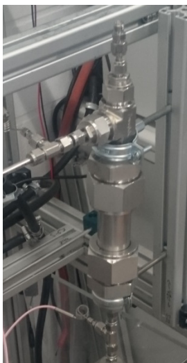
Abbildung 1: Produktabscheider mit vielen Adaptern (ICVT 2 )

beim sog. „Scale-Up“ 1 weniger problematisch sind, kommt es in den Mittel- und Hochdruckanwendungen oft zu großen Herausforderungen in der Konstruktion und Fertigung /2, 3/. Die Auswahl von kommerziell erhältlichen Rohformen und Druckbehältern ist groß, kann aber nicht immer den funktionsgerechten Betrieb bewerkstelligen (konfektionierte Größen und Geometrien). Zudem erfordert die Montage von zertifizierten Bauteilen der jeweiligen Druckstufe, insbesondere bei Querschnittsänderungen der Druckbehälter, viele Adapter (siehe Abbildung 1). Die daraus resultierenden vielen Verbindungen führen zu einer hohen Leckageempfindlichkeit der gesamten Apparatur. /2/