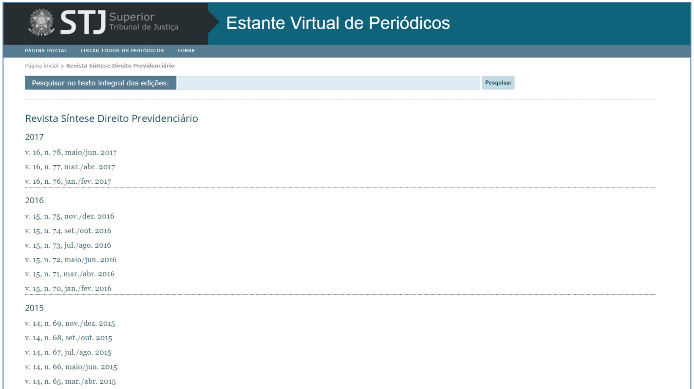
Figura 2 - Tela de um título do periódico contendo os volumes em ordem cronológica decrescente de publicação