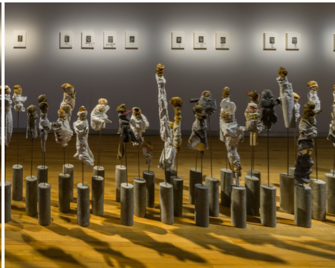
Série Peoples, 2000-2015 Techniques mixtes sur base en ciment, 150 x 51 x 92 cm (approx.)