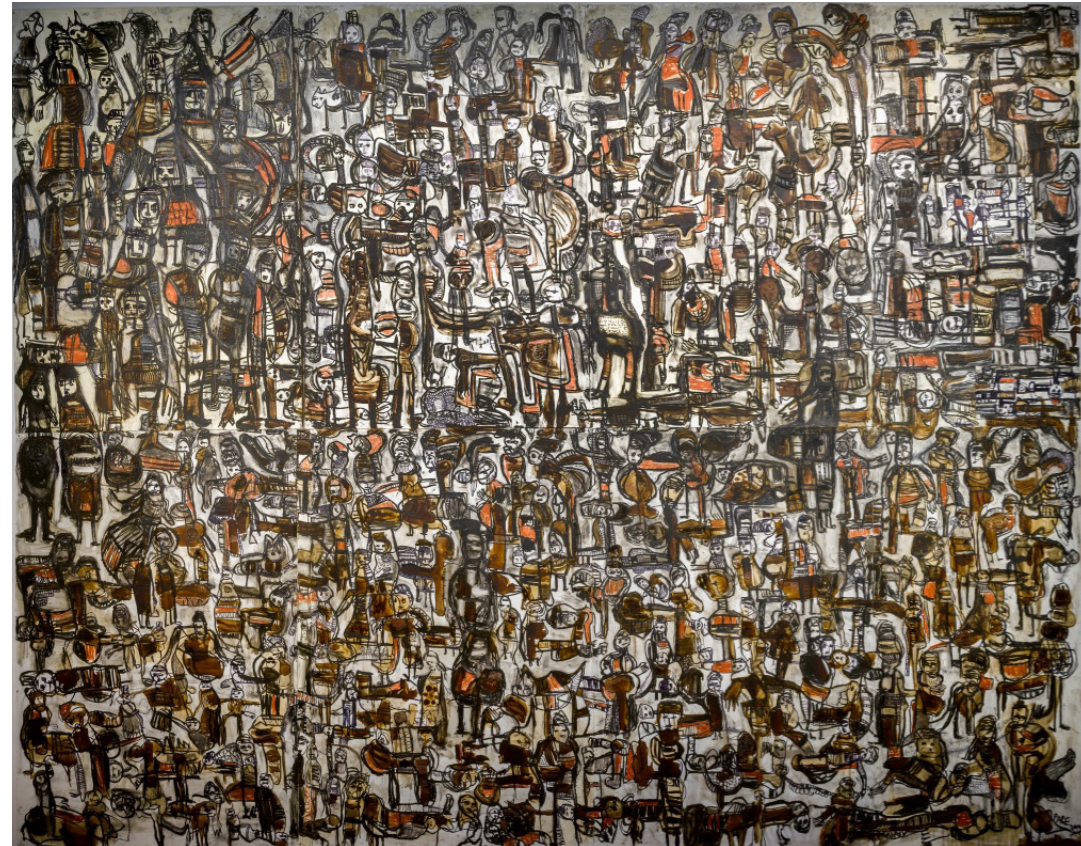
Hommage à René Detroye, 2014 Peinture à l'huile, encre et pastel gras sur styrène, 220 x 320 cm