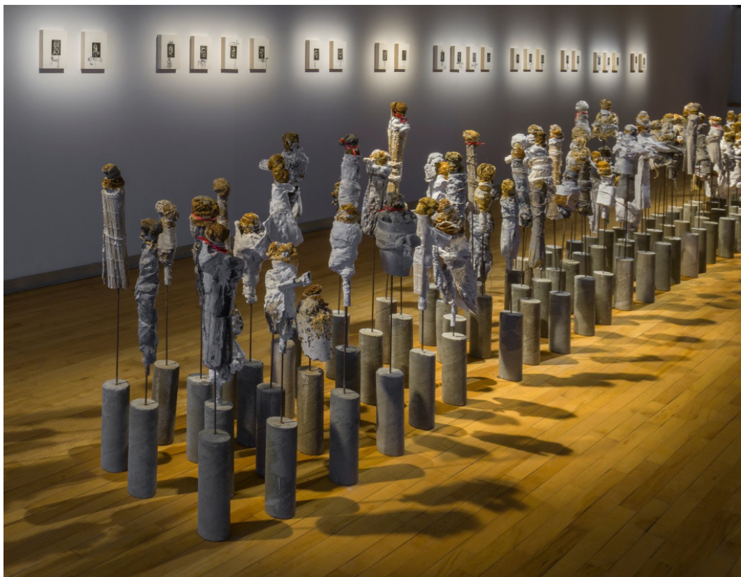
Série Peoples, 2000-2015 Techniques mixtes sur base en ciment, 150 x 51 x 92 cm (approx.)