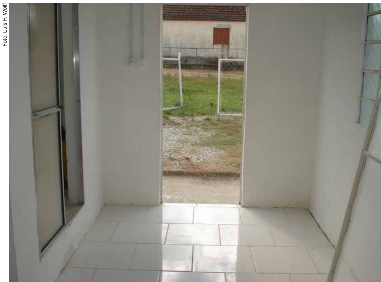
Figura 14. Área de recepção de materiais na Casa do Mel de Pedro Osório, RS.

A área de recepção de materiais (Figura 14) é aquela destinada a receber as melgueiras repletas de quadros com favos de mel trazidas do apiário. Nesta área todos os materiais serão raspados e limpos de possíveis sujidades vindas do campo. Nesta área devem existir estrados em número suficiente para a deposição das melgueiras, evitando que as mesmas entrem em contato direto com o piso e eventuais contaminantes. Os estrados não devem ser de madeira, mas sim de PVC ou outro material lavável e próprio para essa finalidade.