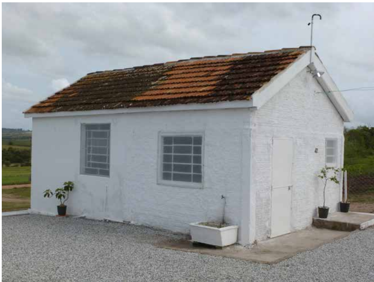
Figura 13. Unidade de extração e processamento apícola em Pedro Osório, RS.