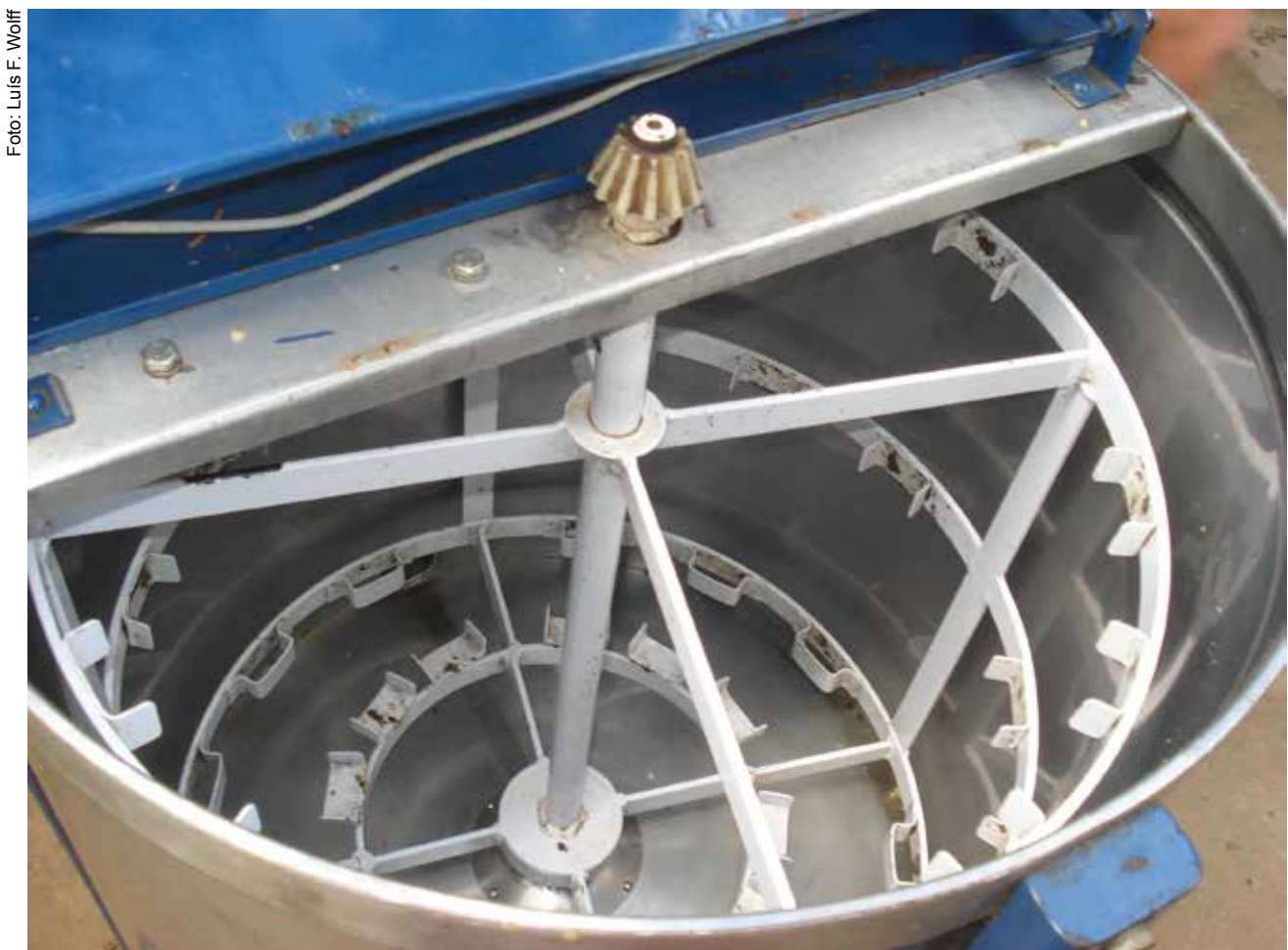
Figura 20. Parte interna da centrifugadora, com grade para colocação dos quadros com favos de mel.