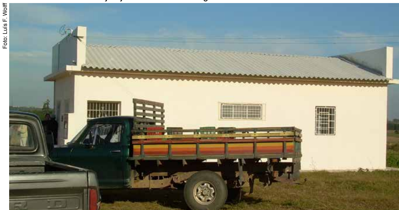
Figura 12. Unidade de extração e processamento apícola em Canguçu, RS.

Moura (2010) concluiu que apicultores que possuem uma unidade de extração e de processamento apícola, mesmo em casos de baixa adoção de boas práticas de produção, apresentam méis com melhor qualidade do que apicultores sem unidades de extração disponíveis. Assim, recomenda a construção de unidades de extração e processamento de mel ou a adequação de estruturas já existentes, como estratégia concreta de garantir melhor qualidade e inocuidade do mel colhido, favorecendo sua colocação junto a mercados exigentes.