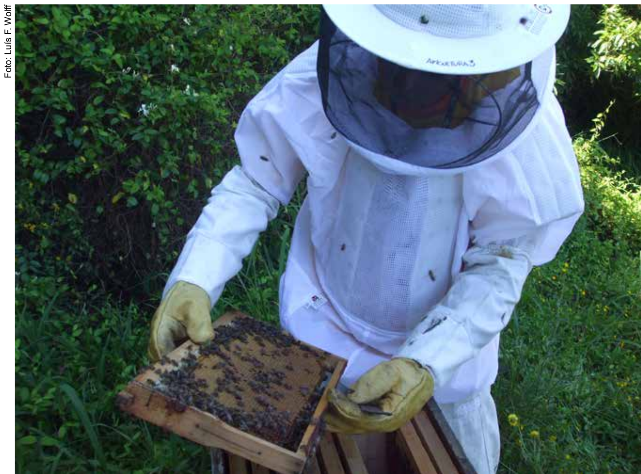
Figura 8. Manejo no ninho e limpeza periódica mantêm a sanidade do enxame e a qualidade do mel.