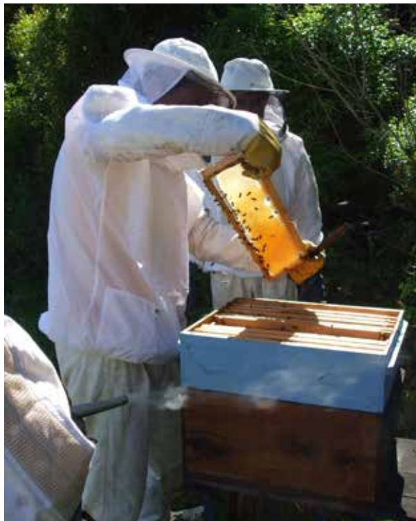
Figura 3. Boas práticas de produção apícola garantem a manutenção da qualidade do mel.