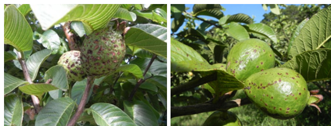
Figura 2. Sintomas de antracnose em frutos de goiaba cultivar Paluma. Pequenas manchas circulares de coloração amarronzada, secas, elevadas e de pústulas em forma de cancos em frutos infectados precocemente (2A); lesões deprimidas, encharcadas, de coloração marrom-clara (Figura 2B).