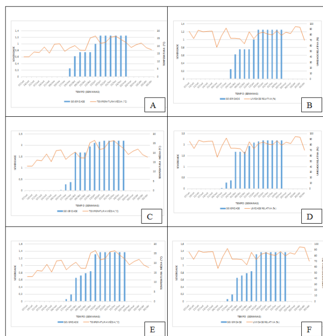
Figura 3. Severidade da antracnose verificada em pomar de goiabeira conduzido na Estação Experimental Cascata, Pelotas – RS, na safra 2016/2017. Temperatura (°C) e umidade relativa (%), respectivamente nas cultivares Paluma (3A e 3B), Sécuro XXI (3C e 3D) e Pedro Sato (3E e 3F).

Recomenda-se utilizar como quebra-ventos árvores de crescimento lento, como por exemplo casuarina, grevilea, acácia, eucalipto, nogueira-pecã, intercaladas com espécies de crescimento inicial mais rápido, como capim-elefante, a fim de proteger a fase inicial de formação de plantas até que se tenha, efetivamente, estabelecido o quebra-vento definitivo.