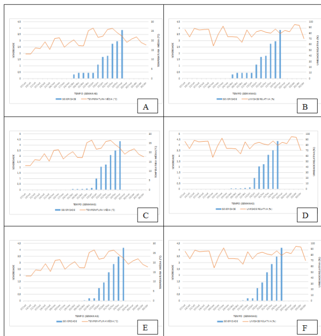
Figura 4. Severidade da ferrugem verificada em pomar de goiabeira conduzido na Estação Experimental Cascata, Pelotas – RS, na safra 2016/2017. Temperatura (°C) e umidade relativa (%), respectivamente nas cultivares Paluma (4A e 4B), Sécuro XXI (4C e 4D) e Pedro Sato (4E e 4F).