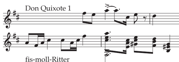
Abb. 4: Fis-moll-Ritter und Don-Quixote-Thema 1

Dass das Heldenleben Strauss als Künstler darstellt, ist offenkundig. Don Quixote , zeitgleich mit dem Heldenleben entstanden, ist das satirische Gegenstück dazu. Warum sollte Strauss nicht auch hier, unter der Maske des Narren wie in Till Eulenspiegel , als Subtext ihn bedrängende Fragen der Kunst verhandeln? Die sehr gegensätzlichen Welten des Defiliermarsches und der Tristan -Chromatik werden überbrückt mit der Schlusswendung des ersten Don-Quixote-Themas: