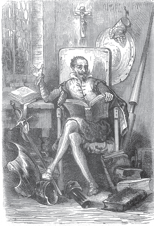
Abb. 1: Cervantes, Don Quixote [1870], Frontispiz

Ihr meinem Sinn anthuet, schwächt so sehr meinen Sinn, daß ich nicht ohne Sinn mich über Eure Schönheit beklage« oder: »Der hohe Himmel, welcher Eure Göttlichkeit mit göttlichen Sternen schmücket und Euch der Würden würdigt, deren Eure Hoheit würdig ist.« Dies kommentiert Cervantes: »Ueber solcher geistreichen Speise zehrte sich das Hirnmark unsers Ritters auf. Er zermarterte sich, einen Sinn aus diesem Wirrwarr herauszuwirren, über welchen selbst Aristoteles vergeblich gegrübelt hätte, wäre er auch ausdrücklich deßhalb wieder auferstanden.« 14 Don Quixotes Romanhelden, Cid Rui Diaz, Bernardo del Carpio, Reynald von Montalban etc., sagen dem heutigen Leser nichts und bedürfen ausgiebiger Kommentare von Romanisten. Diese Art Literatursatire kann Musik nicht abbilden. Strauss half sich damit, dass er für seine Introduction ein eigenes Szenario entwarf. Er stellt uns musikalisch erst Don Quixote selbst, dann Dulcinea und vier Rittergestalten vor. Diese Miniaturepisoden von wenigen Takten werden durch ein langes Lesethema zusammengehalten.