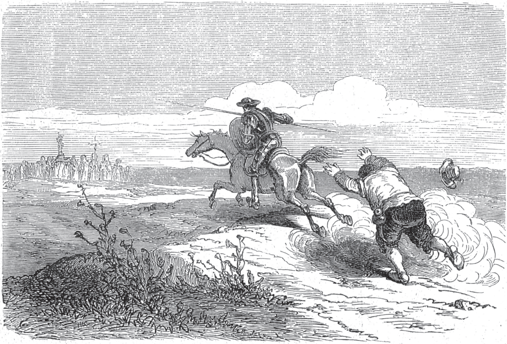
Abb. 23: Cervantes, Don Quixote [1870], vor S. 481

Cervantes erzählt dies Abenteuer im letzten Kapitel (52) des ersten Buches: »Es war nämlich in diesem Jahre kein Regen gefallen, so daß an allen Orten in selbiger Gegend Umgänge mit Gebeten und Bußübungen gehalten wurden, um Gott zu bitten, daß er die Hand seiner Barmherzigkeit aufthue und Regen gebe.« In der verhüllten Marienstatue sieht Quixote eine vornehme, entführte Frau, die es zu befreien gilt. Sancho will ihn zurückhalten: »Wo wollt Ihr hin, Herr Don Quixote? welcher böse Geist reizt und treibt Euch an, gegen unsern katholischen Glauben zu fechten? Thut doch in's Henkers Namen die Augen auf, so werdet Ihr einsehen, daß Ihr einen Bußzug vor Euch habt, und daß die Dame, die sie dort auf dem Gestelle tragen, das Bild der hochgebenedeiten, unbefleckten Jungfrau ist.« 74