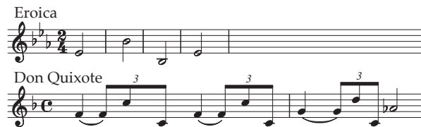
Abb. 19: Don Quixote will Schäfer werden.

Cervantes' Parodie auf die aus Frankreich stammende Mode der anakreontischen Dichtung hat Strauss in musikalische Hirtenmusik übersetzt. Die schlichte Hirtenweise ist bereits in Variation II, bei Quixotes Kampf gegen die Hammelherde, erklungen. Strauss verwendet vordergründig pastorale Topoi: den quasi 6/8-Takt und die großen, naturhaft-urigen Intervalle des Englischhorns. Das erinnert an den Schweizer Kuhreigen, die Hirtenrufe zu Beginn der »Scène aux champs« aus der Symphonie fantastique von Berlioz und an die »traurige Weise« zu Beginn des dritten Aktes Tristan . Doch ist dies eine geschickte Camouflage. Denn Don Quixote fühlt sich ja als Held, der als Schäfer nur die Jahresfrist überstehen will. Im Hintergrund des Schäferthemas steht darum Beethoven: das Thema (bzw. der Bass des Themas) der Variationen in der Eroica .