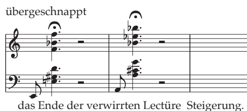
Abb. 14: D-GPrsa, Skizzenbuch Tr. 4, S. 16

Das ritterliche Thema ist in den Takten 105 bis 107 mit dem Lesethema kombiniert (siehe Abb. 11, letzter Takt). Da Lesethema und erstes Don-Quixote-Thema dieselbe Initiale haben, deutet Strauss bloß die Holzbläserläufe an. Mit dem subdominanten Quintsextakkord (T. 107), bevor also in der Introduction (T. 4) die harmonisch seltsame Dominante eintritt, bricht das ritterliche Thema ab. Hier setzt die chromatisch steigende Folge von Dur-Quartsextakkorden ein, die Strauss bereits beim ersten Einsatz des Lesethemas notiert hatte (siehe Abb. 2), sich aber für das Orchestertutti aufgespart hat. Die Akkorde (As, A, B, H) werden mit dem aus der Gilda-Arie abgeleiteten Skalenmotiv des Es-Dur-Ritters kontrapunktiert (T. 108, 109). Mit dem dominantischen Paenultimatakt des Lesethemas verdichten sich die Motive weiter: Zum breit augmentierten Kampfruf in d-moll setzt das galante zweite Don-Quixote-Thema ein (in Celli, Fagotten und Bassklarinetten), dann das Motiv des Es-Dur-Ritters und im Bass der »büßende Ritter«. Bereits nach zwei Takten klingt das dritte Thema an, das mit parallel verschobenen Septakkorden Don-Quixotes Wahn, seine Neigung zu »falschen Schlüssen« versinnbildlicht. Sind bereits das ritterliche und das galante Thema sehr verkürzt, so bleibt das letzte Don-Quixote-Thema, statt zu kadenzieren, auf einer irrwitzigen Dissonanz stecken. Die poetische Idee dieser Dissonanz benennt Strauss in einer Vorskizze drastisch: »übergeschnappt«.