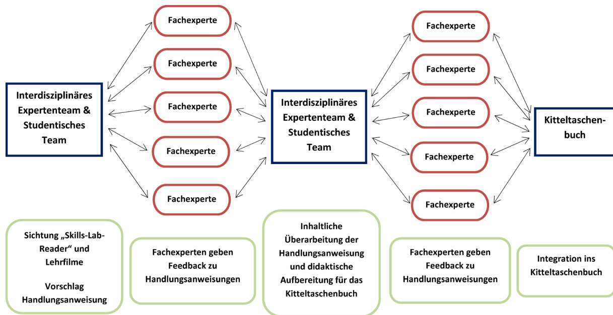
Abbildung 1: Iterativer Abstimmungsprozess zu Lernzielen und Lehrstandard (vereinfachte schematische Darstellung)

von Kitteltaschenbüchern über die Medizinische Fakultät Heidelberg wurden weitere Finanzierungsmöglichkeiten des Projektes erschlossen. Für die Exemplare, die den ärztlichen Dozenten zur Verfügung gestellt werden sollten, lag eine Finanzierungszusage der Verwaltung des Universitätsklinikums Heidelberg vor.