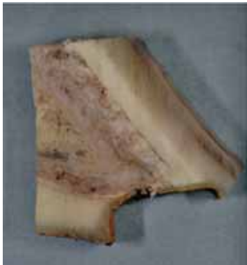
Abb 3 Eine für die histologische Untersuchung entnommene Probe des Hufes nach Aufbrennen des Hufeisens bei einer Sohlendicke von 0 mm.

Messgenauigkeit gerecht zu werden, musste miteinbezogen werden, dass aufgrund divergierender Röntgenstrahlen die auf den Röntgenbildern gemessene Sohlendicke nicht identisch mit der tatsächlich gemessenen Sohlendicke ist. Um diese Ungenauigkeit zu eliminieren, wurde der Korrekturfaktor wie folgt ermittelt: ein exakt 1 cm langes Metallplättchen wurde bei einer Röntgenaufnahme axial auf die Dorsalseite der Hufkapsel geklebt. Im Röntgenbild stellte sich das Plättchen mit einer Länge von 12,18 mm dar. Aus der Differenz zwischen tatsächlicher und gemessener Länge des Metallplättchens wurde ein Korrekturfaktor von abgerundet 1,2 errechnet.