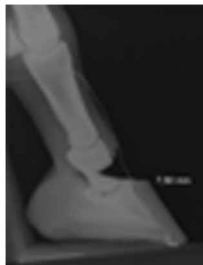
Abb 2 Röntgenologische Messung der Sohlendicke. Measuring the actual thickness of the sole by performing x-rays.

lichen Wärmeleitfähigkeit der Medien Luft (im vorgebohrten Kanal) und Horn. Das Aufbrennen erfolgte mindestens bis zu dem Zeitpunkt, zu dem das Thermoelement einen signifikanten Anstieg der Temperatur anzeigte.