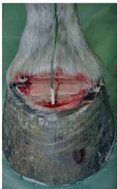
Abb 1a Das Thermoelement des Temperaturmessgerätes (OMEGA, HH12A) in situ. Thermal element of the temperature measuring device (OMEGA, HH12A) in situ.

Ziel der vorliegenden Studie war es demnach, die Sohlendicke zu bestimmen, bei der zwischen Lederhaut und Hornkapsel eine Temperaturveränderung messbar wird und ab der sich auch Gewebeschäden an der Sohlenlederhaut einstellen.