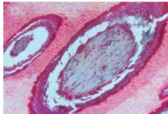
Abb 5 Histologischer Schnitt (Masson-Goldner-Färbung, 1:20), der von einem Huf gewonnen wurde, der bis zur Lederhaut abgebrannt wurde. Im Vergleich mit dem in Abb. 4 dargestellten Querschnitt einer Lederhautpapille werden die Zusammenhangstrennungen zwischen Lederhaut und Epidermis ersichtlich. Es kommt zur Koagulation des Zottenstromas mit Strukturverlust und verminderter Anfärbbarkeit.

Histological sample (Masson-Goldner-stain, 1:20) taken of a hoof with a sole-thickness of 13 mm before performing any branding at all (longitudinal cut papilla of corium on the left, diagonal cut papilla on the right).