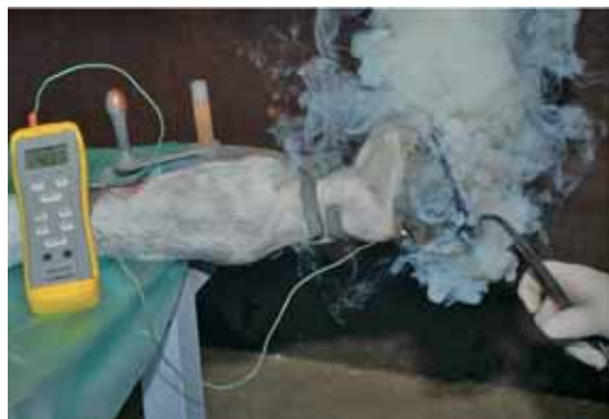
Abb 1b Aufbrennen des Hufeisens bei gleichzeitiger Temperaturmessung. Experimental design to investigate the temperature within the hoof whilst hot-shoeing.

dem dorsalen Kronsegment exzidiert. Diese Öffnung am Kronsaum ermöglichte einen idealen Zugang zur Hufkapsel von dorsal: von dort aus wurde mit Hilfe eines Nagels von ca. 2 mm Durchmesser ein Kanal zwischen dorsaler Hufwand und Lederhaut parallel zum Hufbein vorgebohrt. Anschließend wurde das Thermoelement in diesen Kanal eingeführt und der Sitz durch eine Röntgenaufnahme kontrolliert. Die Spitze des Thermoelementes musste sich im Bereich der Hufbeinspitze zwischen Sohlenhorn und Lederhaut befinden. Die Injektion von Ultraschallgel, das als „Wärmeleitpaste“ fungieren sollte, diente der Überbrückung der sehr unterschied-