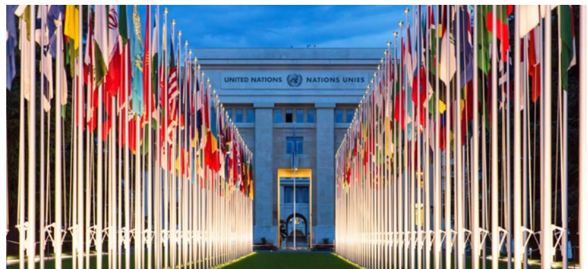
Der «Palais des Nations» ist das europäische Hauptquartier der Vereinten Nationen.