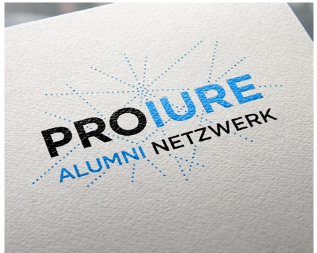
Neues Logo von PRO IURE

PRO IURE tritt nach bald 20-jährigem Bestehen mit einem neuen Erscheinungsbild auf. Sowohl das Logo als auch die Website wurden komplett neu gestaltet und aufgefrischt. PRO IURE will damit erreichen, dass mehr Dynamik in den Verein kommt und sich vermehrt auch junge Mitglieder angesprochen fühlen. Nächstes Jahr feiert der Verein sein 20-Jahr-Jubiläum. Die Vorbereitungen für das Jubiläum laufen bereits auf Hochtouren; die Mitglieder werden informiert, sobald das Programm für den Anlass steht.