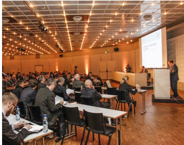
Voll besetzter Saal Sydney im Congress Center der Messe Basel.

Das Fachprogramm wurde durch Berichte aus den jeweiligen Bundesämtern (resp. Bundesministerien) für Justiz über die aktuellen Gesetzgebungsvorhaben in Deutschland, Österreich und der Schweiz abgerundet. Besonders zu erwähnen ist der Vortrag von RA Philipp Weber aus dem Bundesamt für Justiz, der exklusiv den frisch vorliegenden Vorentwurf zur Revision der Schweizerischen Zivilprozessordnung vorstellte. Abschliessend informierte Prof. Rolf Stürner aus Freiburg über die Arbeiten an den «European rules of civil procedure», einem Projekt unter der Schirmherrschaft von UNIDROIT und dem European Law Institute.