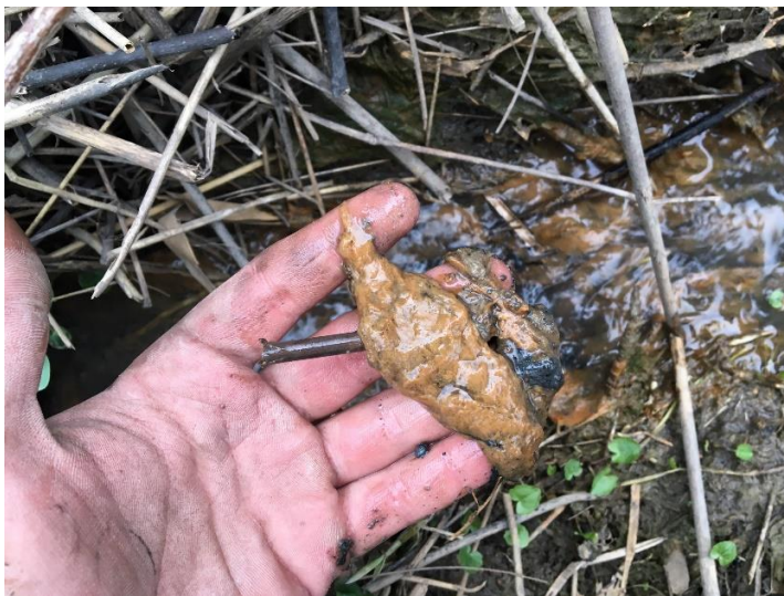
Figur 2. Rostutfällning från dränering vid ett utlopp.

I jordar som innehåller mycket järn kan järnutfällningar förekomma. Dessa kallas för rost. Vanligast är det på lättare jordar som mo- och sandjordar. Järn, syre och rostbakterier reagerar. Efter en tid bildas det rostutfällningar. (Saavalainen 1987). Det är en biologisk-kemisk oxidationsprocess som sker. Slutprodukten av denna process bildar järnhydroxid, ett ämne som från början är en stor slemmig massa i ledningarna och dess närhet, se figur 2. Efterhand som ledningarna torkar upp under sommarhalvåret torkar denna slemmiga massa till en hård kaka eller beläggning som i vissa fall kan totalblockera ledningen. (Kvarnemo 1983).