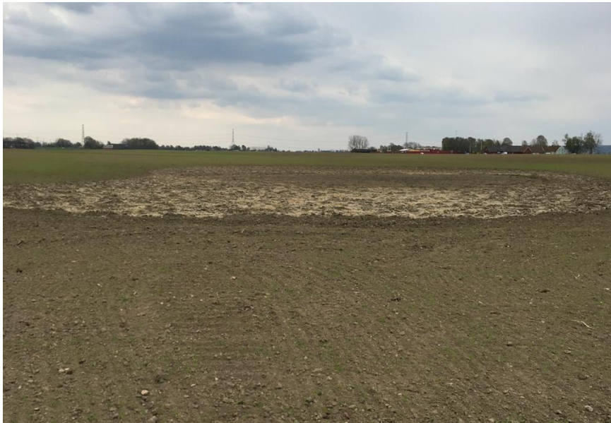
Figur 1.

Figur 1 visar ett område som inte hann torka upp på våren. Med en täckdikning i väl fungerande skick öppnas möjligheter för en friare växtodling där det inte är dräneringen som påverkar valet av gröda utan vad som passar bäst in i växtföljden. Fälten torkar upp cirka 1–2 veckor tidigare på våren och på så vis kan vårbruket påbörjas tidigare. Detta ger grödan större förutsättningar till att utveckla ett djupare och mer omfattande rotsystem som tål en försommartorka bättre än en sent etablerad gröda med ett mindre rotsystem. En väl dränerad jord består av mer luftfyllda porer vilket främjar rotutvecklingen. Enligt Kvarnemo 1983 kan en skördeökning på uppemot 1000 kg spannmål per hektar uppmätas på en jord med bättre balans mellan luft och vatten i växternas rotzon. Med en kraftigare och mer konkurrenskraftig kulturgröda kan ogräsbekämpningen underlättas radikalt. En tidigt etablerad gröda ger möjlighet för skörden att påbörjas tidigare. Med en tidigare mognad blir skördefönstret större och man har större möjlighet att välja ett tillfälle då marken bär bra och på så vis minska markpackningen. Täckdikning medför även en jämnare mognad av grödan vilket bör medföra en lägre torkningskostnad för spannmål. Tidig skörd öppnar möjligheter att kunna etablera en höstgröda i tid som hinner växa till sig och ha en bättre förmåga att övervintra. (Kvarnemo 1983).