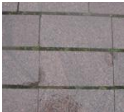
Figur 17. Utspjälkningar och smala fogar.