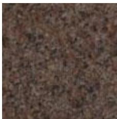
Figur 1. Bjärlöv, polerad.

Nedan följer beskrivning av några i Sverige förekommande stensorter. Då det enligt Sveriges Stenindustriförbund (2002) bryts ca 70 stensorter i landet är detta på intet sätt någon heltäckande lista, utan endast för att exemplifiera namnbruket och ge en kort beskrivning av några relativt frekvent använda sorter.