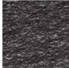
Figur 7. Offerdalsskiffer, klovvyta.