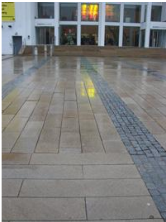
Figur 11. Dunkers entré, Helsingborg.

Vad det hos kommunen finns för erfarenheter av ytans funktion har inte framkommit. Dock är den trafikerade delen av beläggningen omgjord en gång. Då ändrades plattornas läggningsriktning.