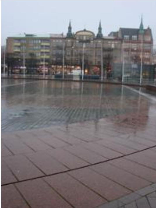
Figur 16. Sundstorget, Helsingborg.

Vad det hos kommunen finns för erfarenheter av ytans funktion har inte framkommit.