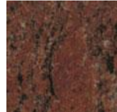
Figur 8. Vånga (AP), polerad.