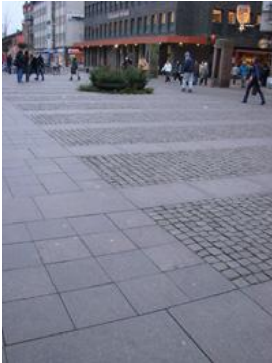
Figur 18. Torgyta, Kristianstad.

Det som upplevs vara beläggningsens positiva egenskaper är att den inte är underhållskrävande och att plattorna klarar aktuell belastning utan att skadas.