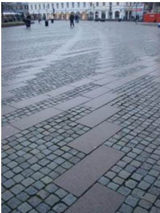
Figur 24. Gustav Adolfs torg, Malmö.