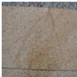
Figur 12. Rostutfällningar och sprickanvisningar.