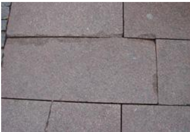
Figur 33. Kraftiga utspjälkningar och spricka.