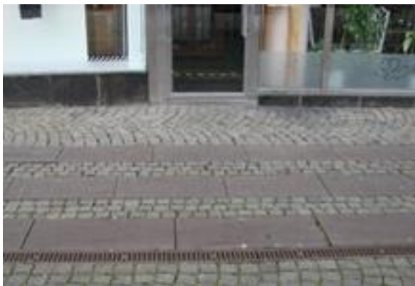
Figur 29. Södertull, Malmö.

Det som upplevs vara beläggningsens positiva egenskaper är att den inte är underhållskrävande, plattorna klarar aktuell belastning utan att skadas och att plattorna ger bra fotfäste vid regn. Dock råder det på Malmös gatukontor delade meningar om huruvida plattorna erbjuder tillräckligt fotfäste vid blöt väderlek.