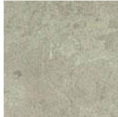
Figur 6. Norrvange, polerad.