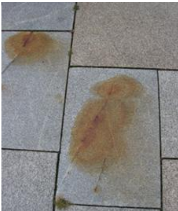
Figur 35. Rostutfällningar och sprickanvisningar.