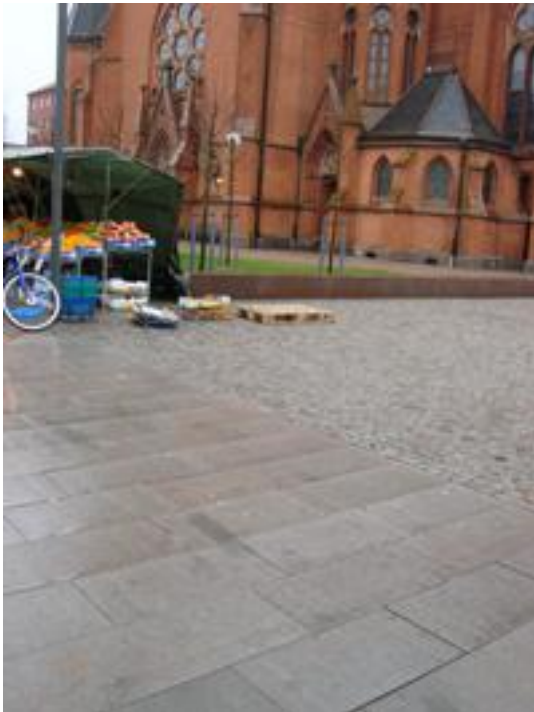
Figur 15. Gustav Adolfs torg, Helsingborg.

Vad det hos kommunen finns för erfarenheter av ytans funktion har inte framkommit.