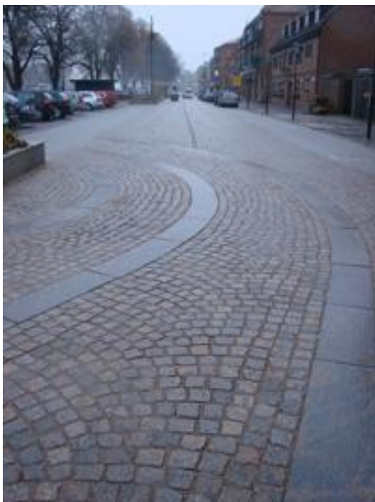
Figur 9: Hamngatan, Halmstad.