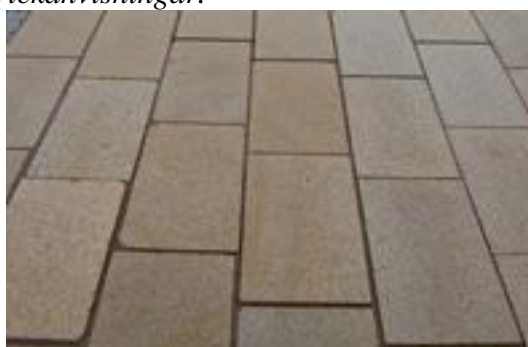
Figur 14. Breda fogar.