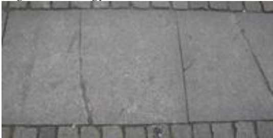
Figur 20. Sprickor