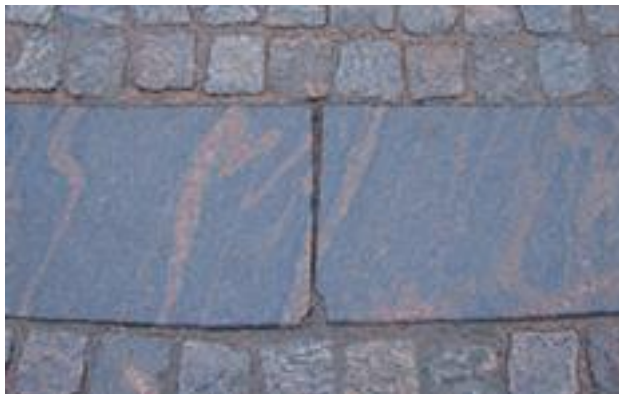
Figur 10: Skadat hörn.