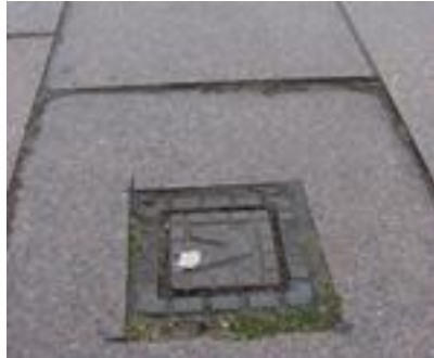
Figur 36. Snubbelkanter till följd av sättningar.

I samband med trädgropar kan sättningar ses, som vid den okulära besiktningen i Lund (figur 23). På en sådan plats förändras förhållandena i marken i takt med att det organiska materialet i trädgropen förmultnar och rötter växer. Dock är sättningar vid trädgropar inte ett problem specifikt för beläggningar av naturstensplattor utan förekommer hos de flesta beläggningar. Problematiken med det rörliga organiska materialet, skelettjordar och så vidare är ett helt annat ämne och lämnas därför därhän.