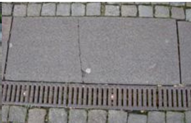
Figur 30. Flyttad platta med spricka.