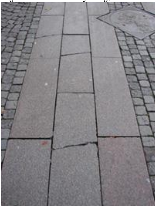
Figur 26. Spräckta plattor där trafiken svänger.