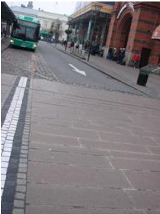
Figur 27. Centralplan, Malmö.

Det som upplevs vara beläggningens positiva egenskaper är att den inte är underhållskrävande, plattorna klarar aktuell belastning utan att skadas och att plattorna ger bra fotfäste vid regn.