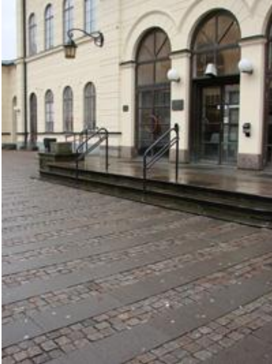
Figur 21. Centralstationen, Lund. Tvärgående hällar.