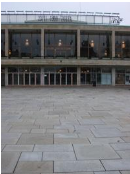
Figur 34. Stadsteatern, Malmö.