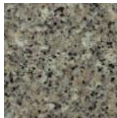
Figur 2. Grå Bohus (Näsinge), polerad.