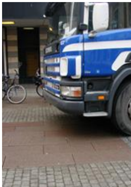
Figur 31. Malmborgsgatan, Malmö. Figur 32. Lastbilstrafik.