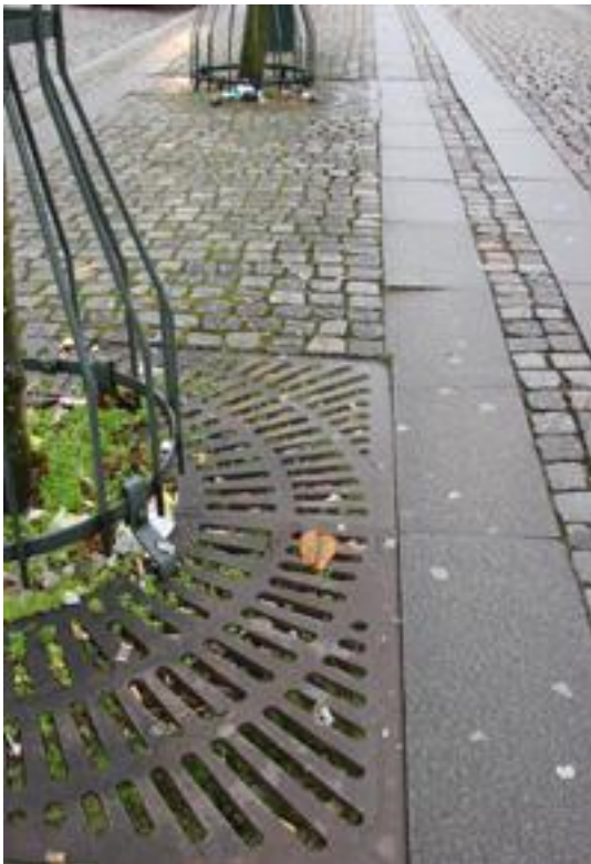
Figur 23. Sättningar.