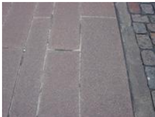
Figur 28. Plattor i bruk inspänt mellan kantstöd av betong.