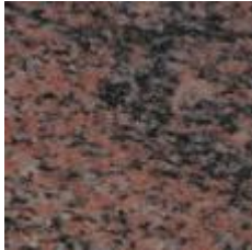
Figur 5. Hallandsgnejs (Bårarp), polerad.

Marmor med flera olika tilläggsbetäckningar, såsom Natur, Blå (figur 4) eller Mörk. Bryts i Glanshammar, Närke (Sveriges Stenindustriförbundet, 2002) och används vanligen till golv, fönsterbänkar och trappor både ut- och invändigt (Sveriges Stenindustriförbundet 2003).