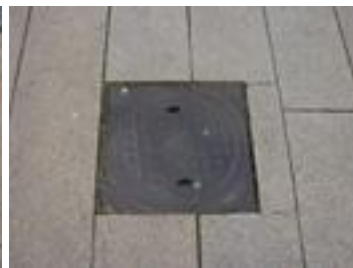
Figur 13. Sprickor.