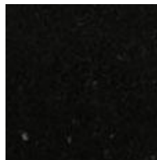
Figur 3. Brännhult, polerad.