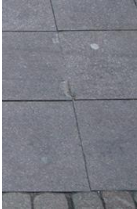
Figur 19. Utspjälkning och smala fogar.