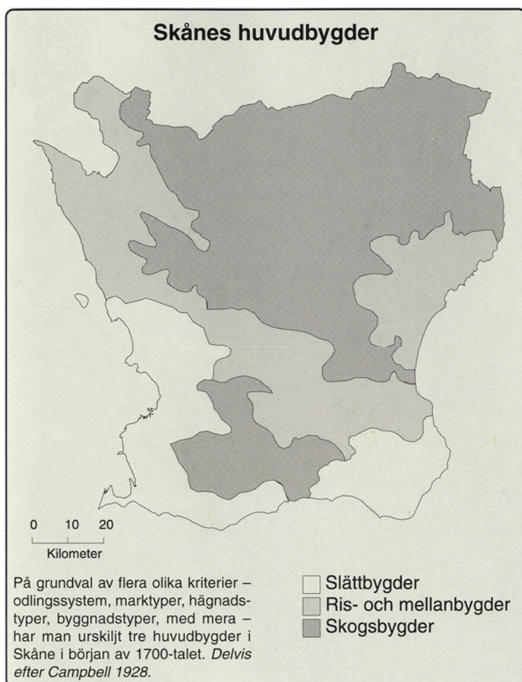
Fig 2. Skånes bygder som de framställs i Det skånska kulturlandskapet (Urban Emanuelsson et al, 2002)