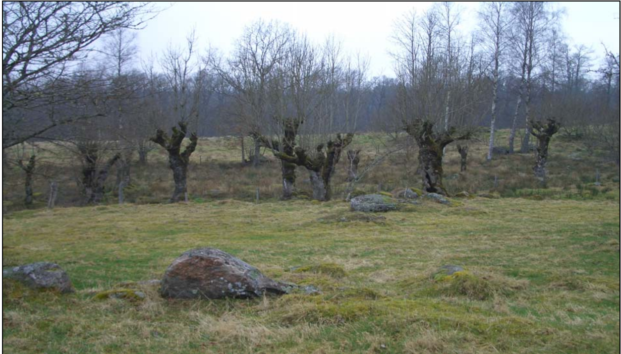
Fig 4. Detta fotografi över Sporrakullas löväng, taget uppifrån nedför slutningen, visar ett antal av de många hamlade askar som finns på området och en bit av slåtterytorna. Värt att notera är hur öppen lövängen är, jämfört med den mosaik av öppet och slutet som beskrivs från förr ovan. I bakgrunden på fotografiet syns det sankt lågområdet.