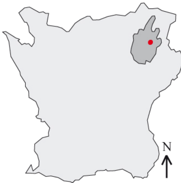
Fig 1. Sporrakulla utmärkt med röd prick i den mörkgrå Östra Göinge kommun. (Illustration, David Lagerstedt)

Sporrakulla gård ligger i en backe, med skog ovanför och lövängen placerad direkt nedanför gården. Den sluttande ängen, som delvis översilas av vatten, slutar i ett sankmarksområde bevuxet av vattenkrävande växter samt ett antal träd såsom klibbalar ( Alnus glutinosa ) och björkar ( Betula pendula respektive Betula pubescens ). Stiftelsen Skogssällskapet tog över Sporrakulla i sin ägo 1983, och har sedan dess skött och restaurerat området tillsammans med Glimåkra Hembygdsförening för att bevara samt kunna visa på det gamla kulturlandskapet. Den omgivande skogen består delvis av planterad granskog ( Picea abies ), men annars till största delen av ek ( Quercus robur ) och bok ( Fagus sylvatica ), respektive mindre inslag av asp ( Populus tremula ), lind ( Tilia cordata ), björk och