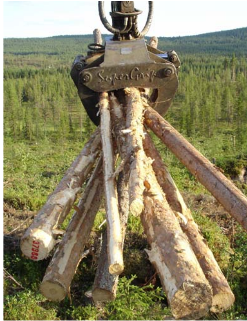
Figur 3. Kvastformation på virke.

Figure 3. Problem with brush formed logs.