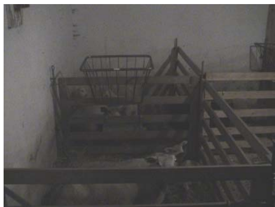
Figur 14. Höhäck

Kraftfoder förvarades i silo i anslutning till stallet och utfodrades med spann. För avskiljda tackor fanns höhäckar (figur 14) och kraftfoderkrubbor.