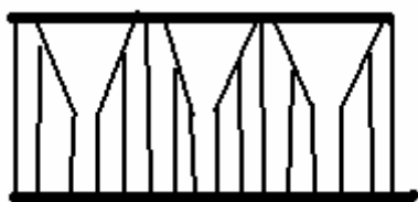
Figur 2. Fodergrind med Y-front

Y-front är bra till får med horn. Annars kan dessa ha svårt att få in huvudet. Det smala utrymmet nertill förhindrar att de backar (figur 2).