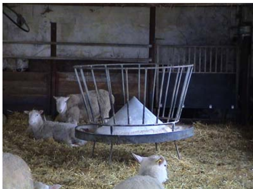
Figur 11. Siltbergs runda höhäck

Siltbergs runda höhäck (figur 11) används för utfodring av kraftfoder till slaktlammen. Det är helt enkelt en rund krubba på ben med ett galler som kan hålla upp hö. I mitten är botten utformad som en hög kon vilket gör att inget foder blir liggande i mitten och utom fårens räckvidd.