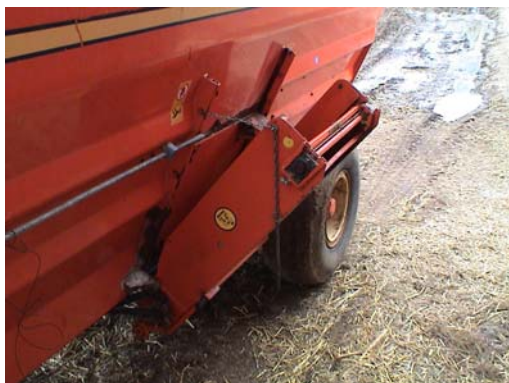
Figur 6. mixervagn med utmatningselevator

Foderbandet (figur 7,8 o 9) av märket Albouy fungerar som ett foderbord och är placerat mitt i tackstallet. Det är ett band av gummiduk som går att köra i båda riktningarna. Bandet fylls i ena änden av stallet där det sticker ut genom väggen. Det drivs av en elmotor och man kan justera mängden på bandet genom att minska eller öka hastigheten. När man har fyllt så mycket att det är fullt hela vägen så stannar bandet automatiskt. Sidorna är tillverkade av galvaniserad plåt och det finns luckor för fåren att sticka in huvudet i. När man fyller bandet så stänger man alla luckorna med hjälp av två spakar vid inmatningen. Sen kan man öppna för alla fåren samtidigt. De foderrester som fåren inte äter upp töms genom att backa bandet.