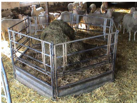
Figur 10. Knarrhults fodergrind

Knarrhults fodergrindar (figur 10) används som rundbalshäck för ensilage till slaktlammen. De byggs ihop i en cirkel och kan justeras av fåren själva efterhand som fodermängden minskar. Öppningen för fårens huvud kan justeras lite efter storlek på fåren.