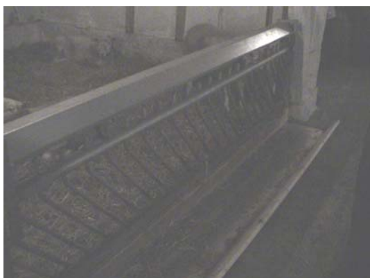
Figur 13. Holländskt foderbord

Den tredje varianten var ett Holländskt foderbord (figur 13) med träkrubba och front som bestod av sneda metallrör som var fast i nedre änden och lösa i ovankanten. Se beskrivning av fodergrind med täta lösa ribbor under avsnittet bakgrund. På det holländska foderbordet fanns dessutom en speciell kraftfoderkrubba som man kunde fälla upp när man inte utfodrar kraftfoder. Den krubban är lagom smal till kraftfoder. Det breda foderbordet som är fast passar bättre till ensilage.