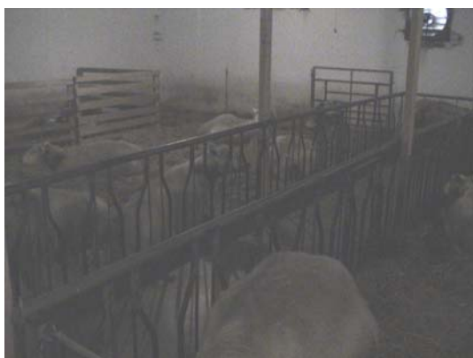
Figur 12. Alfalaval foderbord

De 60 tackorna utfodrades på foderbord i tre olika utförande. Tackorna gick inne i ett före detta kycklingstall. Den låga takhöjden begränsade delvis mekanisering av utfodringen. Ett av foderborden var av Alfa Laval fabrikat (figur 12). Se beskrivning av fodergrind med Y-front under avsnittet bakgrund. Underlaget på foderbordet bestod av en träkonstruktion. På en del av dessa foderborden fanns en hemsnickrad variant. En enkel konstruktion av träribbor, med liknade utformning som Alfa Laval inredningen.