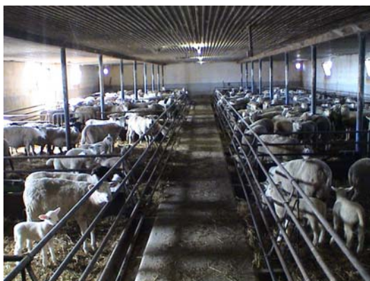
Figur 17. Fjolårslamm i svininredning

Tackorna skiljdes vanligtvis inte av när de lammat. Flasklamm utfodrades med flaska.