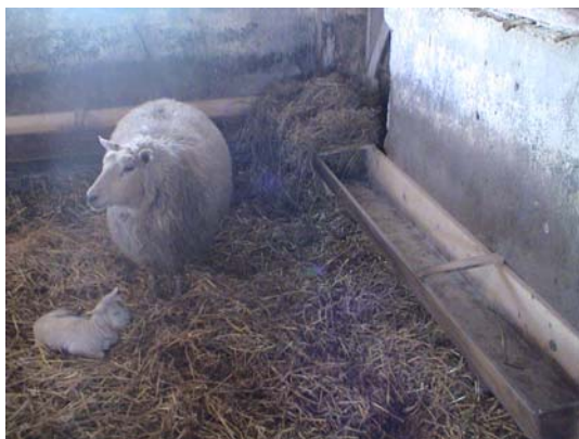
Figur 16. Kraftfoderkrubbor

Fjolårslamm hölls inne i ett gammalt svinstall (figur 17). Kraftfoder utfodrades med hjälp av en vagn i de befintliga krubborna. Ensilage utfodrades direkt på gången så att fåren åt genom inredningen. Ensilaget kördes ut med en kärra som fylldes på för hand.