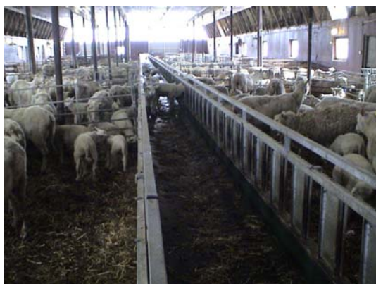
Figur 8. Foderband i stallet (lamm på bandet)