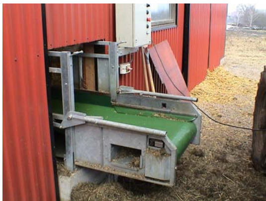
Figur 9. Foderband, inmatning

Tackor som är avskiljda med sina lamm utfodras direkt på bädden med samma fodermix. Flasklamm hölls avskiljda och utfodrades med fri tillgång på mjölkersättning och kraftfoder.