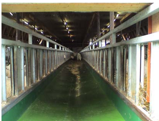
Figur 7. Foderband

Foderbandet (figur 7,8 o 9) av märket Albouy fungerar som ett foderbord och är placerat mitt i tackstallet. Det är ett band av gummiduk som går att köra i båda riktningarna. Bandet fylls i ena änden av stallet där det sticker ut genom väggen. Det drivs av en elmotor och man kan justera mängden på bandet genom att minska eller öka hastigheten. När man har fyllt så mycket att det är fullt hela vägen så stannar bandet automatiskt. Sidorna är tillverkade av galvaniserad plåt och det finns luckor för fåren att sticka in huvudet i. När man fyller bandet så stänger man alla luckorna med hjälp av två spakar vid inmatningen. Sen kan man öppna för alla fåren samtidigt. De foderrester som fåren inte äter upp töms genom att backa bandet.