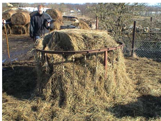
Figur 15. Hemgjord rundbalshäck

Hemgjorda rundbalshäckar (figur 15) användes för att utfodra ensilage till de 150 tackorna utomhus. Hela rundbalar ställdes in med lastmaskin.