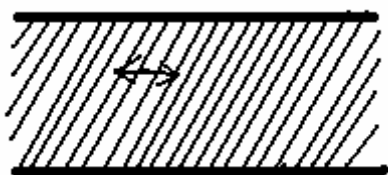
Figur 3. Fodergrind med täta lösa ribbor

I en grind med täta ribbor som är lösa upptill, måste fåren för att få in huvudet, föra ett rör till sidan. Eftersom rören faller tillbaka igen så förhindras lammen att hoppa upp i fodret (figur 3).