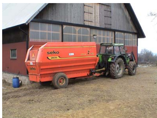
Figur 5. mixervagn

På gård 1 utfodras de 300 tackorna med fullfoder. Mixervagnen som används för att blanda foder till fåren är en vagn som drivs av traktor. I botten på vagnen finns två horisontella skruvar som river sönder och blandar fodret. Vagnen fylls i det här fallet med rundbalsensilage, HP-massa och kraftfoder. För att lägga i fodret används en traktor med frontlastare. Foder blandas en gång om dagen, vanligen på morgonen. När vagnen har blandat fodret lastas det av genom en lucka och ut på en elevator (figur 5 o 6).