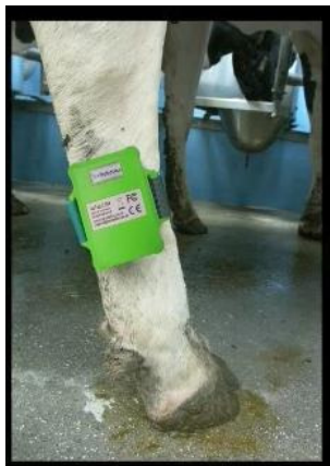
Bild 7: Pedometer Icerobotics Icetag på bakben

aktivitet, stod respektive låg. Dessutom registrerades antalet steg under den aktuella minuten.