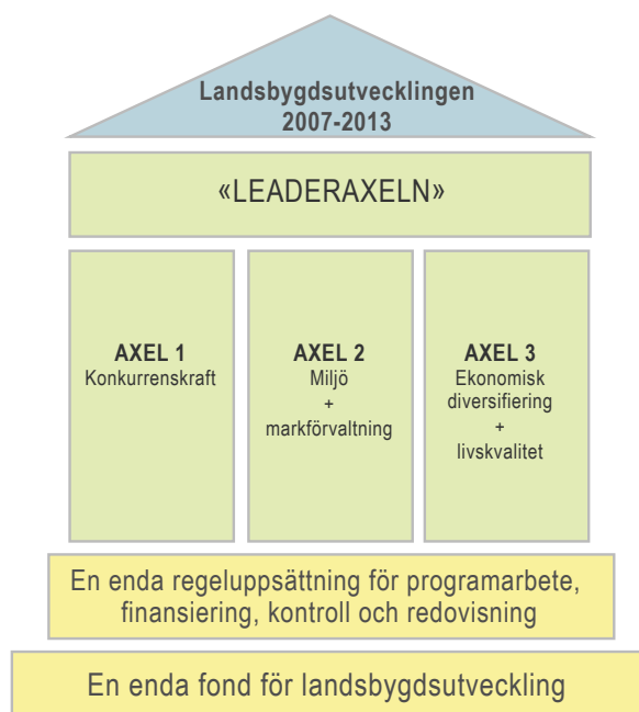
Figur 1. Landsbygdsutvecklingens uppdelning på fyra axlar (Europeiska gemenskaperna, 2006). 2

Landsbygdsprogrammet innehåller även inbyggd (ekonomisk) prioritering av de ekologiska och ekonomiska aspekterna av hållbar utveckling, vilket är en avspeglning av den europeiska jordbrukspolitiken mål och strategier (se Europeiska gemenskaperna 2006).