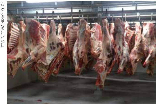
Figur 2. Hängmörning av parter på hängingsanläggningen efter mobil slakt.

TRADITIONELLT HÄNGS SLAKTKROPPEN i hälsenan med sträckta bakben (akilleshängning). Det har visat sig att om den istället hängs i bäckenet med böjda höftleder (bäcken-hängning eller 'tender stretching') sträcks ryggmuskula-turen ut, vilket resulterar i att ryggbiffen och vissa andra dyrbara styckdetaljer blir mörare. Bäckenhängning (14, 15) tillämpas inte regelmässigt av storskaliga slakterier, bland annat eftersom den kräver mer utrymme i sidled än akilles-hängning. Mörheten ökar också med hängningstiden. Vid småskalig slakt hängs köttet ibland en eller ett par veckor, men storskaliga slakterier brukar istället stycka slaktkrop-pen kort tid efter slakten och utföra vakuummörning. En alltför lång hängningstid kan innebära ökade hygienrisker. Det mobila slakteriet bäckenhängde helfallen i samband med slakten, före kylning (Figur 1). Partering utfördes i samband med överföringen från den mobila kylenheten till mörningsanläggningen, varefter köttet i de flesta fall häng-mörades i parter till sju dagar efter slakt (Figur 2). På det stationära slakteriet akilleshängdes helfallen i en-två dagar