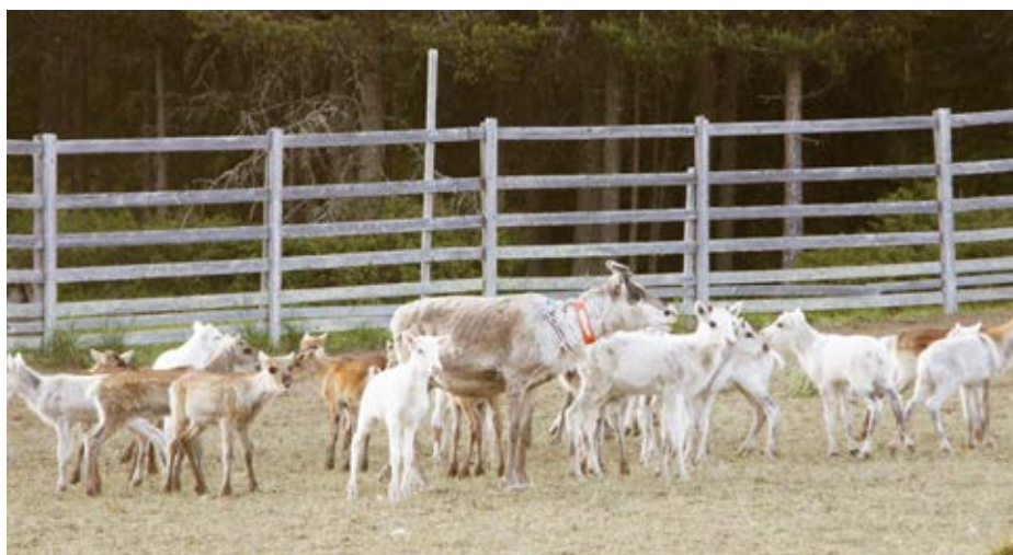
Figur 2. Flera kalvar samlade före märkning.

vandring mellan områden med lämpligt bete under olika delar av året och medför att rensköterna lättare kan kontrollera och hålla ihop hjorden.