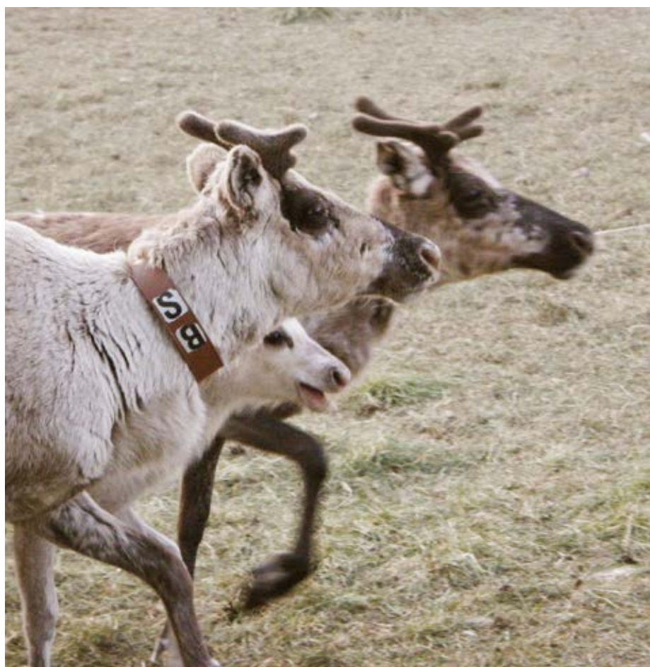
Figur 1. Renko (vaja) med GPS-halsband.

I en tidigare studie utvärderades effekterna av en ökad hänsyn i skogsbruket till rennäringens behov i enlighet med föreslagna åtgärder i Svenska Samernas Riksförbunds policy. Dessa skötselråd förväntas gynna både rennäringen och tillväxten av lav men för skogsbruket kan dessa anpassningar leda till lägre virkesproduktion. Rekommendationerna innefattar skonsammare markberedningsmetoder och alternativa dragningar av vägar, undvikande av plantering av främmande träslag, t.ex.