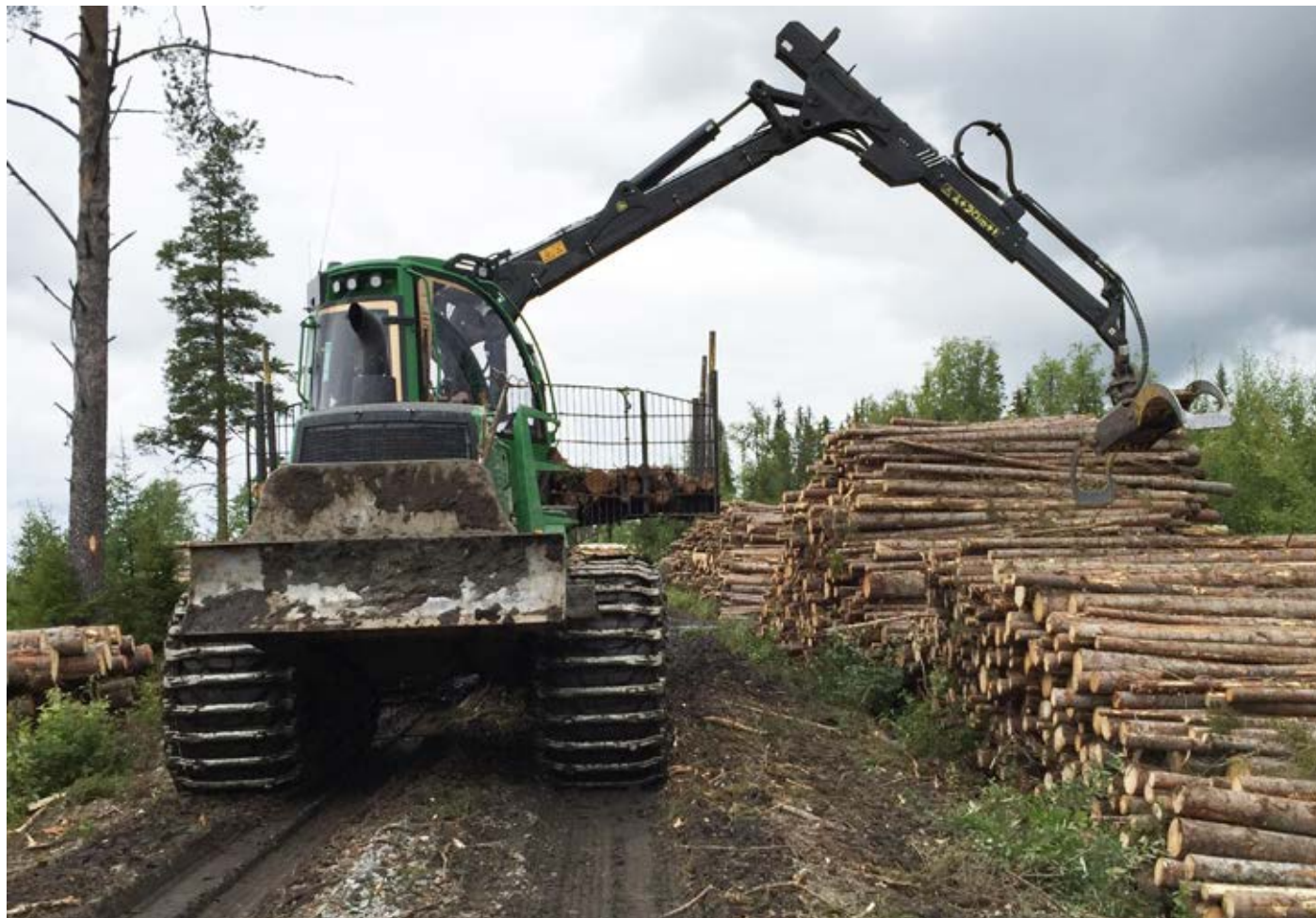
Skotaren JD1910E i arbete åt SCA Skog (maskinen på bilden är inte direkt kopplad till denna rapport).