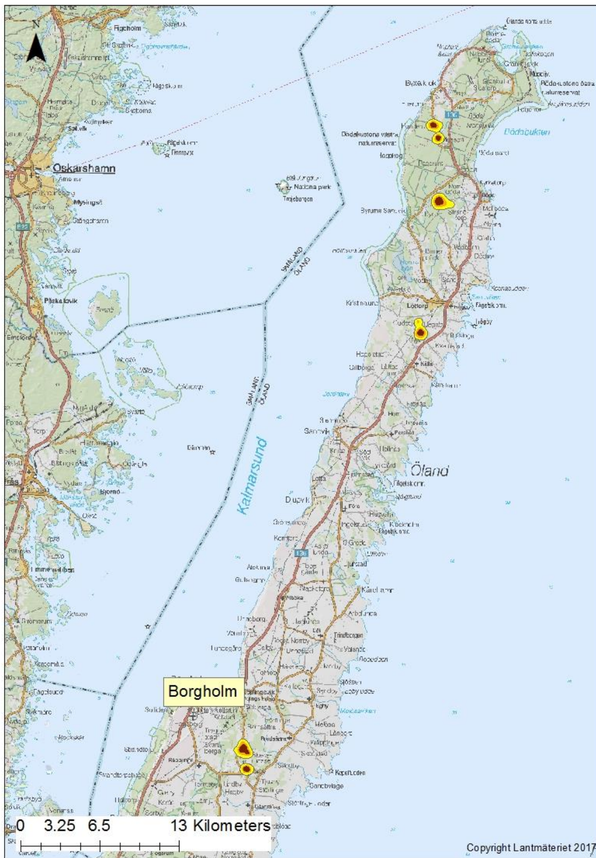
Figur 2. Genomsnittliga hemområden mars till augusti 2016 GPS-märkta rådjur på Öland. Områden rör sig över under hela året (gul, 95 % skattningar) och kärnområden (röd, 50 % skattningar).