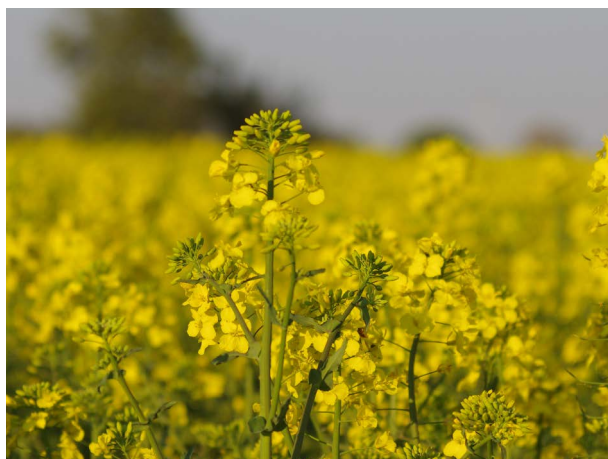
Humlor och solitärbin i sydsvenska rapsfält påverkades negativt när utsädet betats med en neonicotinoid.

sory Council (EASAC). EASAC är ett samarbete mellan 15 europeiska vetenskapsakademier med syfte att förse EU:s politiker med oberoende vetenskaplig information i politiskt angelägna frågor. Forskarna drar i sin rapport slutsatsen att det är allt mer som talar för att neonicotinoiderna har allvarligt negativa effekter på nyttoinsekter som pollinerare och naturliga fiender. De konstaterar att små doser av dessa bekämpningsmedel finns kvar i miljön under lång tid och att sådan exponering kan räcka för att leda till en negativ påverkan på nyttoinsekter. Vidare konstaterar forskargruppen att regelmässig betning med neonicotinoider inte följer grundläggande moderna principer för växtskydd som innebär att bekämpningen ska vara behovsanpassad och främst ske med förebyggande och icke-kemiska metoder. Man befärar också att användningen av neonicotinoider motverkar möjligheterna att uppnå EU:s politiska mål om att främja den biologiska mångfalden i jordbrukslandskapet.