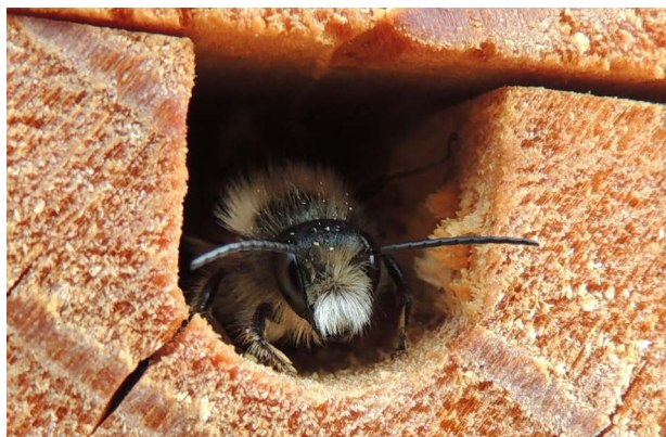
Bilden visar ett rödmurarbi - den art av solitärbin som misslyckades helt med att etablera bon vid rapsfält betade med neonicotinoider.

SLU-forskaren Ingemar Fries har bidragit till ett expertutlåtande om användning av neonicotinoider från European Academies Science Advi-