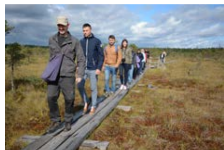
Resande workshop med intressenter i fallstudier i Ryssland, Sverige och Lettland.

påverkas av faktorer i flera olika skalor. Utifrån ett ekologiskt perspektiv är det viktigt att förbättra förståelsen av hur förändringar i brukande påverkar biotopers kvalitet, storlek och placering i landskapet, men även processer som växtätarens betande, predation eller hydrologi.