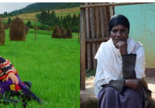
Traditionell kunskap upprätthåller kulturella och sociala värden i landsbygdsområden genom multifunktionell markanvändning.