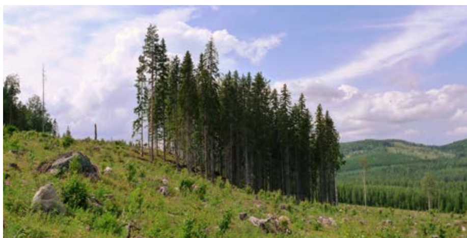
Figur 3. Den stora trädvolymen i denna trädgrupp sänker den förväntade träd mortaliteten. Å andra sidan är gran det känsligaste trädslaget och vindexponeringen relativt stor. Träd tätheten är dessutom stor, vilket för gran ökar mortaliteten.

Av de döda träden låg 71 % som vindfallen på marken, vilket talar för att vind var den dominerande dödsorsaken.