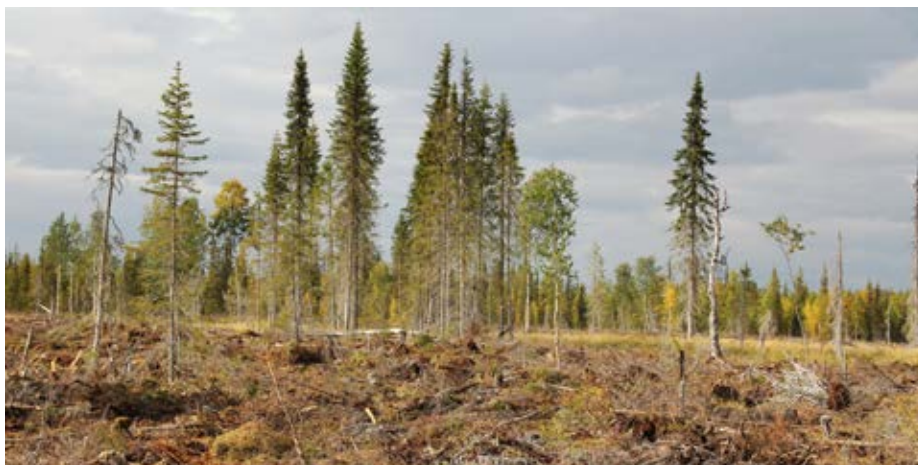
Figur 4. Den totala trädvolymen i hänsynsgruppen är viktigare än hur stor area den täcker, så i ett bestånd som detta är risken för trädmortalitet relativt hög.

”Det var alltså trädens totala volym i gruppen snarare än trädgruppernas yta som påverkade trädmortaliteten.”