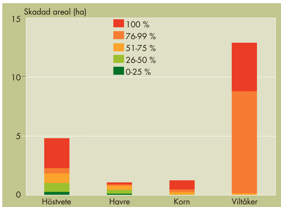
Figur 1. Skadad areal fördelad i olika klasser av skadegrad på den inventerade ytan (40 ha havre, 100 ha korn och 160 ha vete). Totalt motsvarade de hundra procentiga skadorna 2,8 % av arealen för vete och 2,2 respektive 1,8 % av arealerna för havre och korn.

normskörd för respektive gröda kunde vildsvinsskadorna uttryckas som förlorad skörd (kg) för hela arealen. I beräkningar av skördeförlust utslöts viltåkrarna, eftersom syftet där var att locka till sig vildsvinen. Aktuella prisnivåer för spannmål i regionen användes för att beräkna inkomstförlusten.