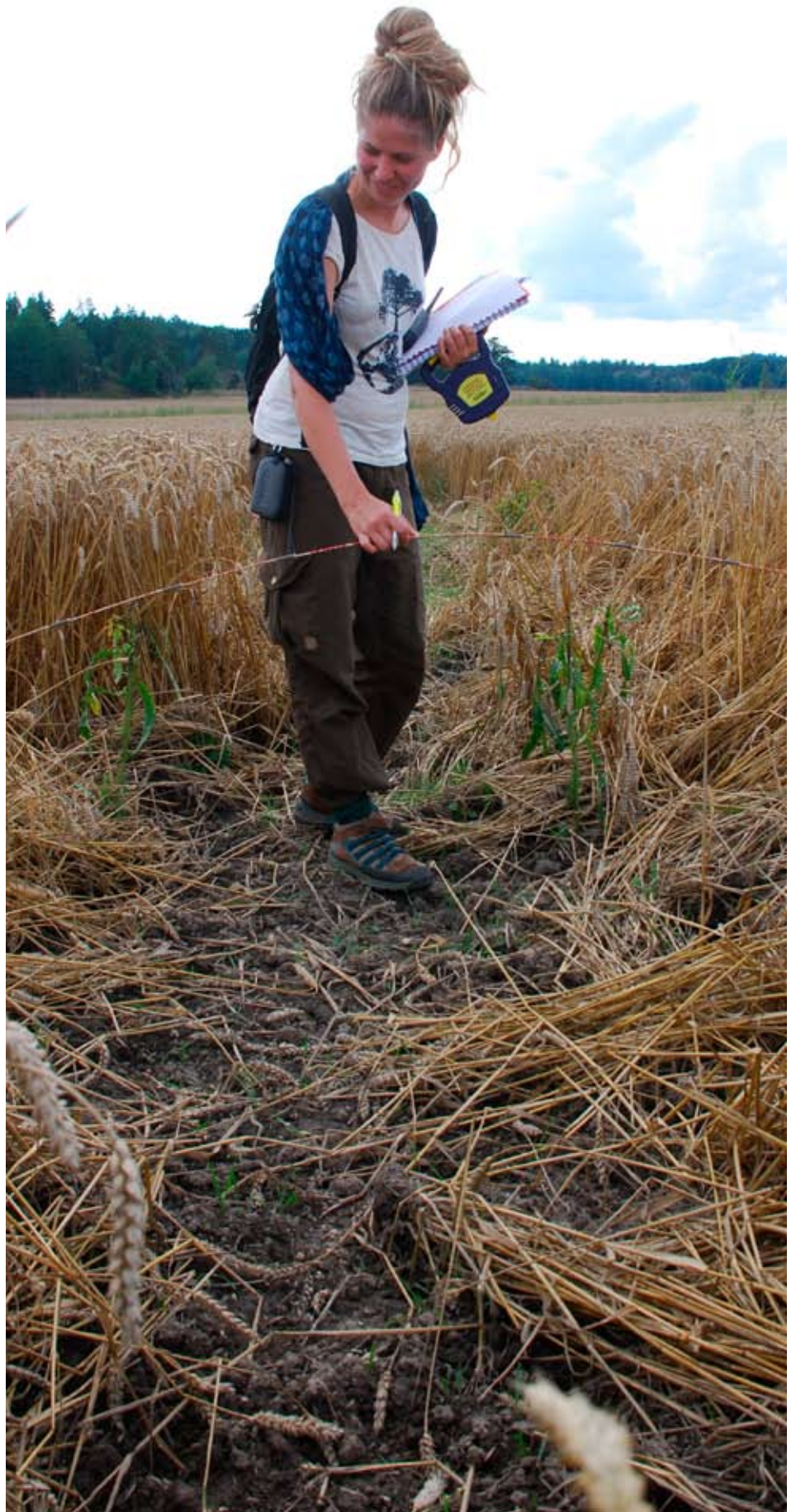
Inventering av skada.

Skördeförlusten beräknades på produkten av den uppmätta ytan och den procentuella skadegraden i skadefläcken. Vi använde medianen på de fem skadeklasserna (för skadeklassen 0-24% användes faktorn 0,12 som ett medelvärde för skadegrad). Genom att använda medelvärdet på fastighetens