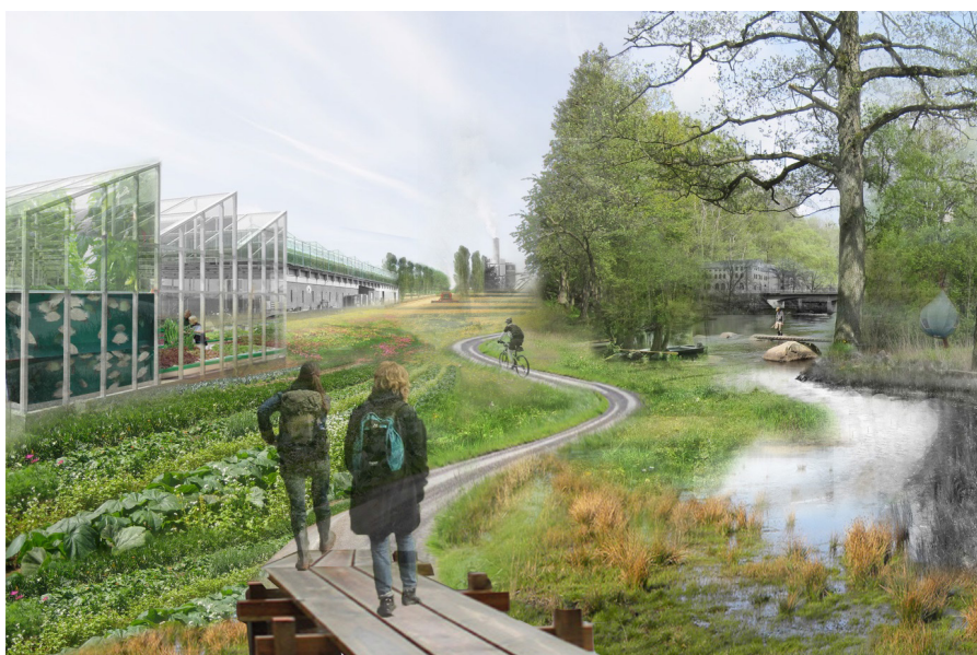
Figur 1: Visionsbild från masterkursen Energy Landscapes & Master Planning, SLU Alnarp 2014 (Bratthäll, m.fl., 2014)

Vid SLU Alnarp och särskilt inom ramen för Swedish Surplus Energy Collaboration (SSE-C) pågår ett flertal projekt där syftet är att uppnå synergieffekter och konkurrensfördelar för den svenska hortikulturella primärproduktionen genom industriell symbios; där restvärme och organiskt restavfall används som resurser för produktionen i ett slutet kretslopp. Detta minskar bl.a. behovet av kylning av restvärme för industrin samtidigt som man sänker kostnaderna för uppvärmning av växthus och fiskodling. I detta specifika projekt i Karlshamn undersöks hur etableringen av sådan industri kan underlättas genom ett mer strukturerat samarbete med den kommunala, fysiska planeringsverksamheten samt universitet och högskolor. Här presenteras ett första koncept för MDHAP.