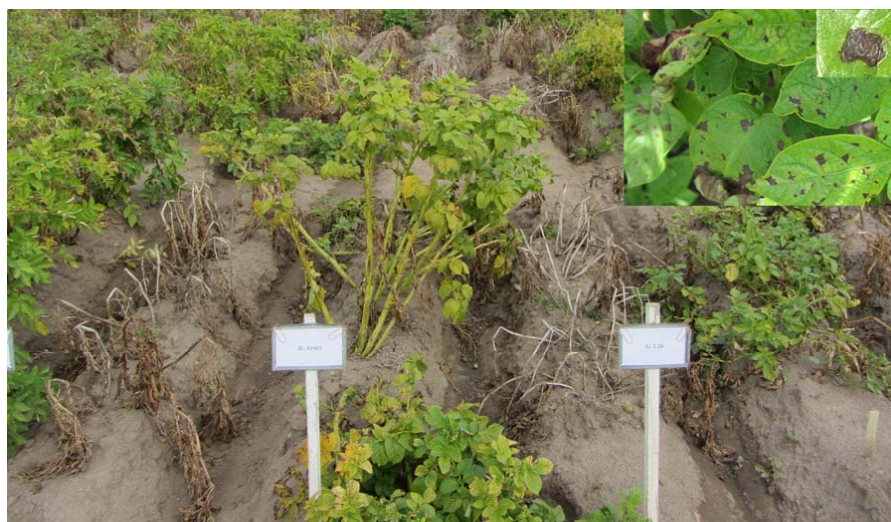
Figur 1. Skillnader i resistens mot torrfläcksjuka ( Alternaria solani ) mellan olika potatisorter i fältförsök 2013. I övre högra hörnet visas närbilder på typiska symptom. Foto: Erland LiljerOTH 29 aug, 2013.

Vi har därför undersökt i fält om det finns resistensskillnader mellan några av de mark-