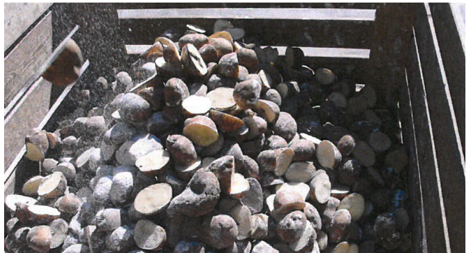
Kluvet och talkat utsäde.

Det är viktigt att utnyttja utsädets potential fullt eftersom utsädeskostnaden är en stor utgift i stärkelseodlingen. Utsädeskostnaden utgör i dagsläget ca 40 % av de rörliga och ca 20 % av de totala odlingskostnaderna i stärkelseodlingen. Det gör