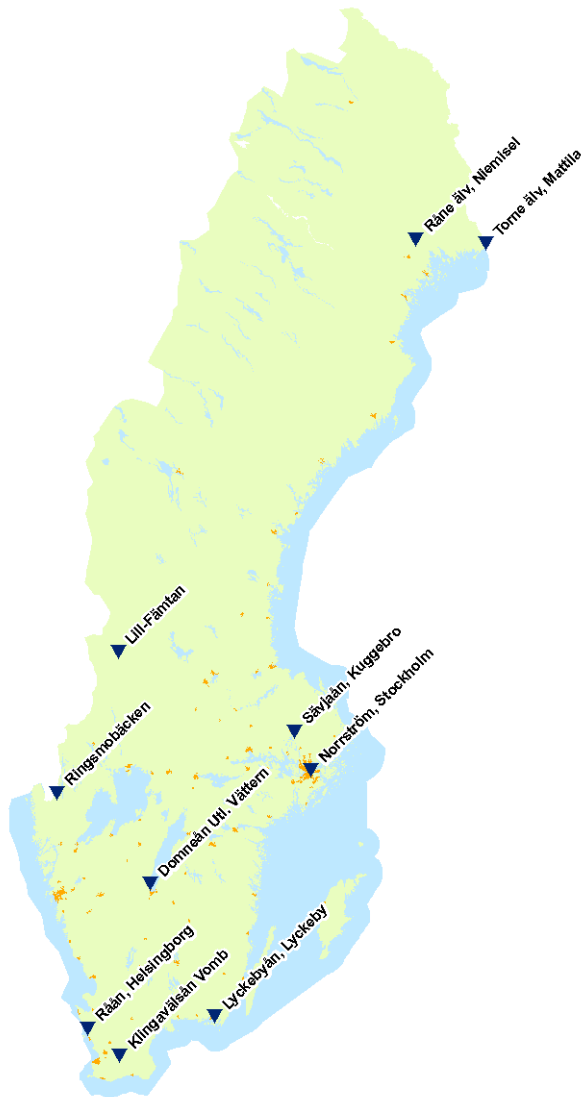
Figur 1. Karta över de studerade vattendragsstationerna. Figure 1. Map over studied watercourses.

representerar typiska vattensystem som dränerar marker med varierande inslag av skog, myr, fjäll, jordbruk, tätort och enskild bebyggelse.