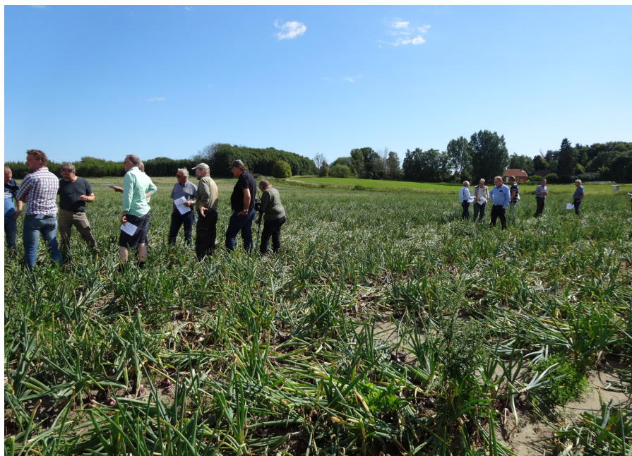
Erfarenhetsutbyte lökodlare emellan är en bra källa till kunskap

Erfä-grupperna består oftast av ett antal odlare som träffas och utbyter erfarenheter med fokus på möjligheter och lösningar. Av de tillfrågade lökproducenterna är 80 procent antingen redan med i erfä-grupper eller positivt inställda till att vara med i en sådan. För att de ska fungera får det inte vara för långt att åka, träffarna ska fokusera på positiva aspekter och inte bara på dåliga priser och bristen på kemiska preparat. Det framkom också synpunkter på att kunskaper inte bör stanna inom gruppen utan spridas allmänt för att tillsammans stärka svensk lökodling.