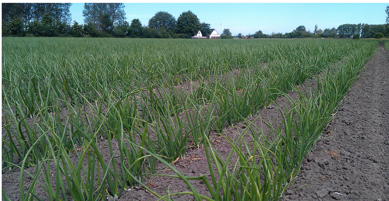
Lökodlarna efterlyser mer erfarenhetsutbyte och bättre samordning

Förstudiens huvudsakliga slutsats är att de svenska lökodlarna efterlyser mer erfarenhetsutbyte och bättre samordning mellan universitet, rådgivare, myndigheter och odlare. För framtiden är det extra viktigt att säkerställa en god lönsamhet för svensk lökodling så den unga generationen vågar satsa. Det finns inte någon stor efterfrågan bland svenska lökproducenter att det ska utvecklas ytterligare dokumentationsverktyg och manualer för kvalitetsutvärdering.