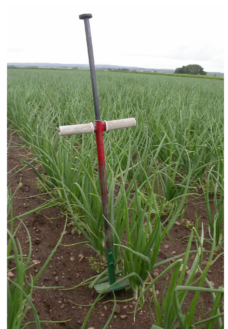
Jordborr – ett bra redskap för att öka kunskapen om jordens egenskaper

De ekologiska odlarna är anslutna till KRAV. Samtliga övriga intervjuade odlare är anslutna till IP Sigill eftersom detta är nödvändigt för att få marknadstillräde. Hur uppgifterna för redovisning till IP Sigill tas fram varierar stort. Flera antecknar först på papper som sätts i pärmar. En del lämnar över dessa uppgifter till fru/rådgivare, andra matar själv in uppgifterna i