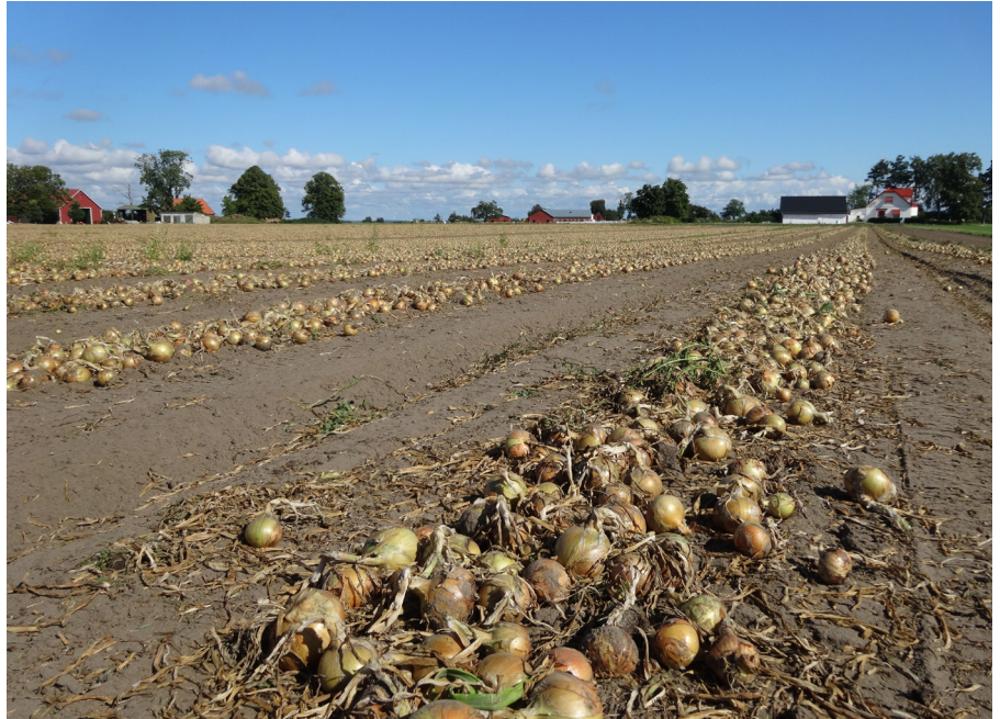
Fälttorkning av lök i strängar, snart redo för långtidsförvaring i kylskåp

Det finns ingen tydlig enskild faktor som upplevs som ett hinder för utvecklingen av svensk lökodling. Förutom lönsamhet och tillgång på kemikalier nämns bristen på utbildade odlare, och bristen på nya unga odlare som ett allt större hinder. Generationsväxlingen går trögt och en del anser