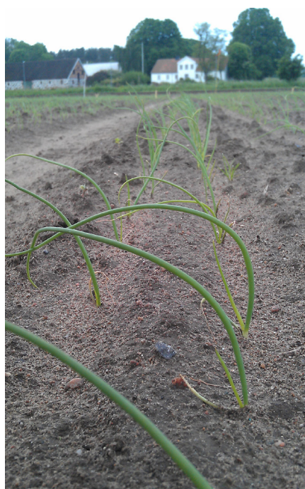
Lök i dubbelrad sex veckor efter sådd

deltagit i projektet speglar den bredd som återfinns inom lökodlarkåren då det gäller såväl erfarenhet, företagstyp som odlad areal.