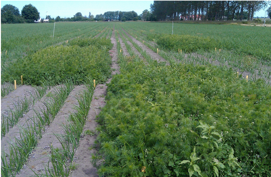
Att minska ogräsförekomsten är oerhört viktigt vid lökodling