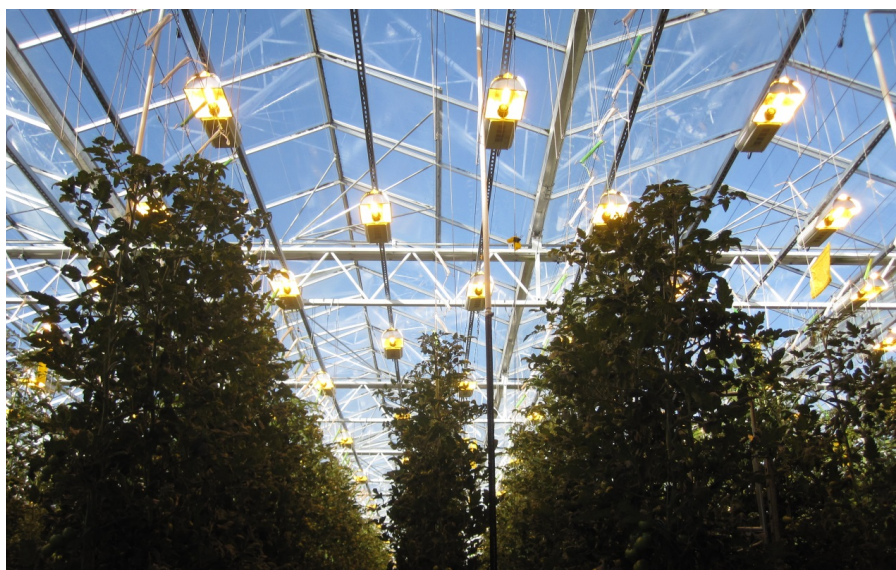
Bild 1: Högtrycksnatriumlampor är fortfarande det bästa valet i många fall. Här 600 W-armaturer i året-runt-produktion av tomater i Norge.

Att mäta ljus innebär att ge sig in i en djungel av olika enheter och sensorer. Ofta har man använt lux, som är ett välkänt begrepp och där det finns mätare att köpa till rimliga priser. Lux är dock mindre lämpligt att mäta ljus från lampor avsedda för växtbelysning, inte minst om det gäller t.ex. LED-lampor med stort innehåll av blått ljus och rött