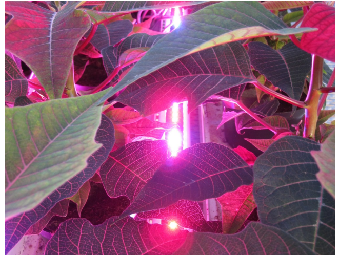
Bild 3: LED-armaturer kan monteras inne i beståndet. Ljus underifrån ger lika god tillväxt som ljus ovanifrån, och man slipper skugg effekter från de ofta ganska omfattande LED-armaturerna.

ligen att ha både 630 och 660 nm. Att man ofta satsat enbart på blått och rött ljus kan vara en orsak till att användningen av LED-ljus med "optimerad" spektralfördelning ofta varit till besvikelse. En annan orsak är att växterna med tiden anpassar sig efter det ljus som finns tillgängligt. Dessutom ger avsaknaden av IR-strålning från LED-lamporna lägre bladtemperatur. Vid odling i växthus måste man vara uppmärksam på detta och kompensera genom höjd lufttemperatur, i annat fall kommer lägre tillväxt och längre kulturtid att bli resultat av den lägre bladtemperaturen. En fördel med LED-ljuskällor är att de kan utformas i stort sett enligt önskemål, och placeras nära plantan, t.ex. inne i beståndet, tack vare den låga värmestrålningen. På så sätt eliminerar man skuggverkan från armaturerna och utnyttjar också värmen som avges från armaturerna via konvektion.