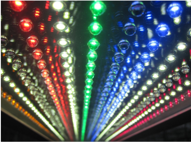
Bild 2: Med LED-baserade ljuskällor är det möjligt att sätta samman i princip vilket ljusspektrum man önskar. Att använda enbart rött och blått ljus är däremot ofta inte att rekommendera.